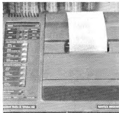
Het navtex systeem

En Navtex-ontvangers kunnen geprogrammeerd worden, zodat er selektief mee kan worden ontvangen. Het is bijvoorbeeld mogelijk alleen de veiligheidsberichten van de Finse kuststations te ontvangen. Voorlopig is het gebied dat met Navtex bestreken wordt nog beperkt, maar er wordt gewerkt aan een wereldwijd systeem met satellieten waarmee ook de