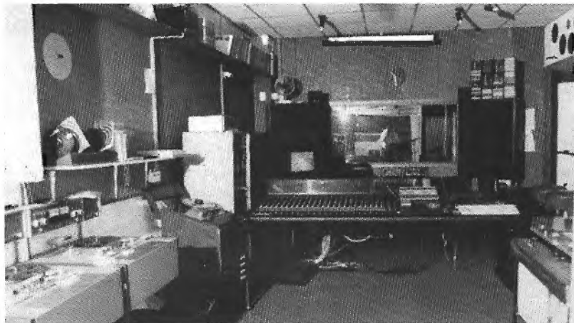
Een kijkje in de studio van Ziaja & Dorst.

De geluidsopnamestudio van Ziaja & Dorst kan zich meten met de top op broadcast-niveau in Nederland. De meest geavanceerde apparatuur staat de producent tot zijn beschikking, zodat Ziaja & Dorst niet alleen voor zichzelf opneemt, maar ook regelmatig de studio verhuurt aan kollegaproducenten. De werkzaamhe-