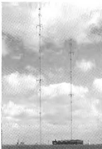
Middengolf zendstation Flevoland voor radio 1 en 5 (AM)

derde programma gebruikt. De voornaamste reden voor het plaatsen van al die FM-zenders was het frequentiegebrek op de middengolf. Vanwege dat frequentiegebrek werden er steeds meer hulpzenders op de middengolf geplaatst en dus werd de ontvangst slechter, dus moesten er meer steunzenders geplaatst worden enz. enz. Door nu gebruik te maken van de