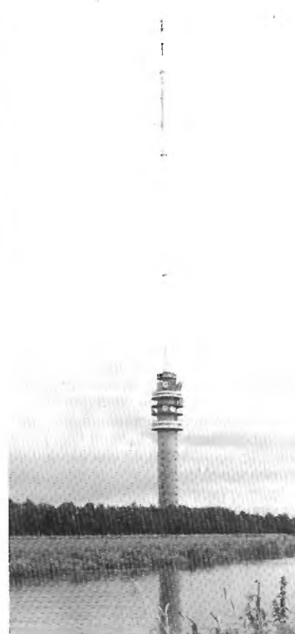
Zendtoren Smilde voor FM radio/tv

Als je het artikel over de wereldomroep hebt gelezen in Disco Dance enige maanden geleden weet je dat ook deze omroep gebruik maakt van NOZEMA zenders. Een giganties projekt dat in 1956 afgerond werd. Drie 100 KW zenders, een van 50 KW en een van 10 KW inclusief "gordijnantennes", waren het resultaat van een in 1952 gestart projekt. Nu, ruim 30 jaar later, zijn deze verouderd en heeft de NOZEMA alweer een nieuw zenderpark voor de Wereldomroep neergezet. Meer vermogen, betere antennes en enorme mogelijkheden wat betreft richting en vermogen van het uitgestraalde signaal... de NOZEMA verzorgde het.