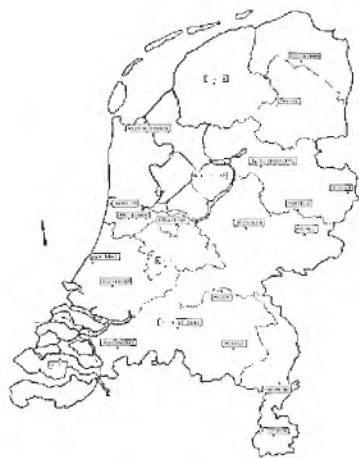
Regionale FM zenders

Den Helder werd ook nog een frequentie-omzetter geplaatst. Het signaal van IJsselstijn werd daar ontvangen en opnieuw, op de andere frequentie, uitgestraald. In heel Nederland was het signaal toen te ontvangen. Al snel hierna werd begonnen met een uitbreiding voor een tweede televisie-net. De eerste Nederland 2 zender werd in 1964 in Lopik in gebruik genomen. Eerst nog bescheiden met 250 KW, later op volle sterkte: 1000 KW. Omdat de ontvangst in de randgebieden niet voldoende was, mede door het gebruik van de UHF-band, werden voor het tweede net twee steunzenders in Arnhem geplaatst. In 1970 werden in de echte probleemgebieden frequentiewisselaars geplaatst.