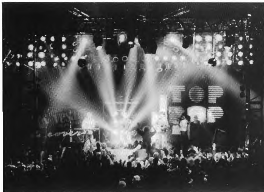
Veel licht bij AVRO's Discovery.

In de hal hangt een gigantisch lichtstelsel, staat een waanzinnig groot podium en een stevige geluidsinstallatie. Kortom, apparatuur, die elk popfestival van enig Europees belang graag zou gebruiken. De totale podiumoppervlakte van de artiestenbühne en de aparte disco unit bedraagt tweehonderd vierkante meter. Vijftien mensen zijn twee dagen lang bezig alles op te bouwen. De licht- en geluidsinstallatie kost plus minus tweeënhalve miljoen gulden! Het geluidsvermogen bedraagt ongeveer 30.000 watt! De lichtinstallatie met een totaalvermogen van 400.000 watt bevat zo'n 300 lampen. Lichten in alle soorten, waaronder robotlights, PAR 64 blazers, basic-, point- en strobolights en volgspots, hangen verspreid over de vier hoeken van de zaal. Alles gaat met computergestuurde afstandsbediening, zodat het licht kantelt, draait, wentelt, flinkt en knippert. Extra effecten zijn er in de vorm van rookmachines, neonbakken en een schrijvende