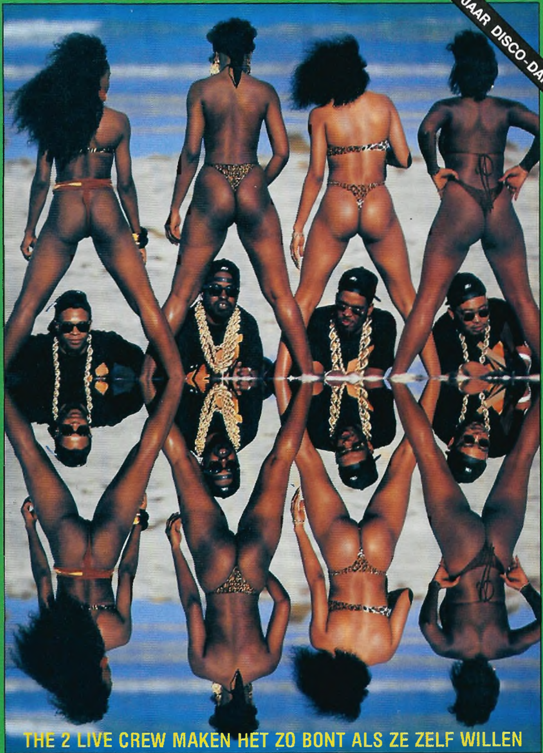
THE 2 LIVE CREW MAKEN HET ZO BONT ALS ZE ZELF WILLEN