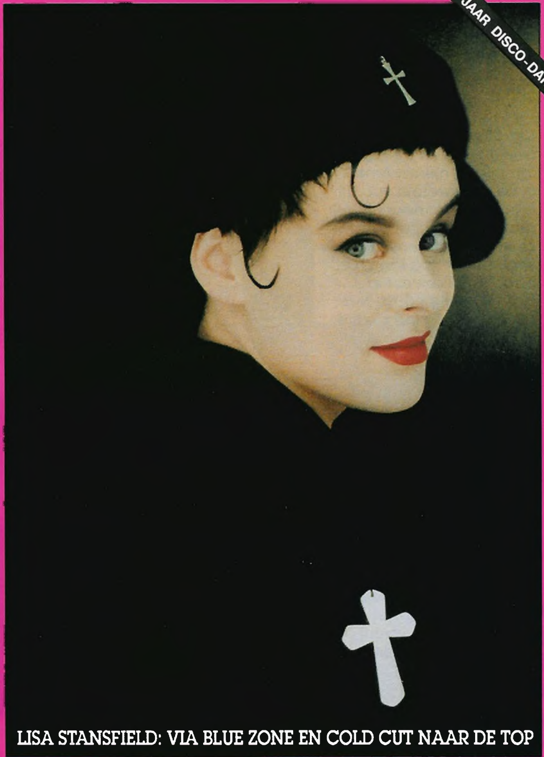
LISA STANSFIELD: VIA BLUE ZONE EN COLD CUT NAAR DE TOP