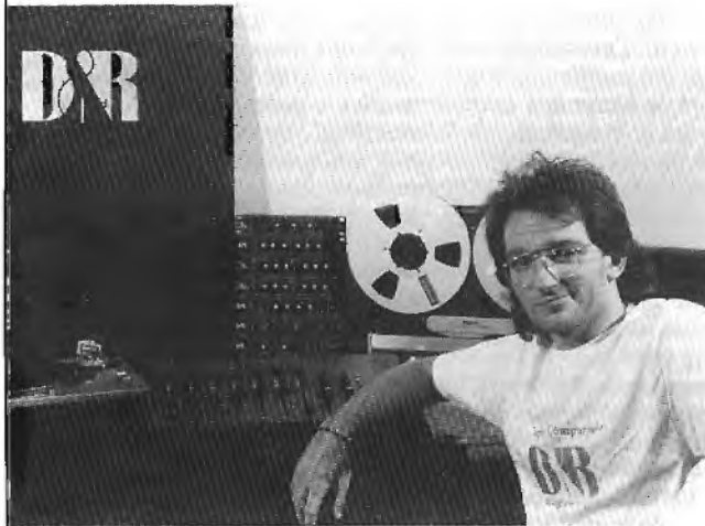
De Discom2 kost slechts Hfl 1395,00.

De Discom2 is een bijzondere discotheekmixer, een "werkbank" zoals Jeroen zijn Discom noemt. Snel, betrouwbaar en alle mogelijkheden om je ook op weg te helpen naar succes.