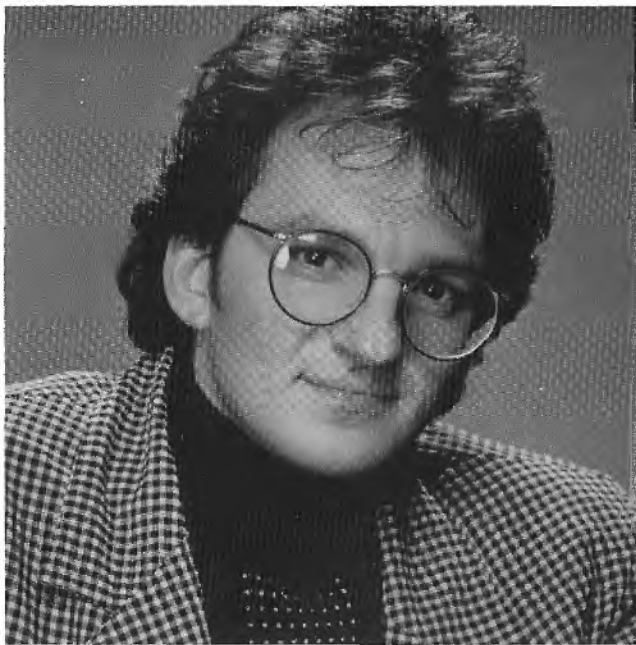
Mensen horen het niet dat een deejay een intro goed volpraat, ze vinden dat een programma lekker klinkt of niet.