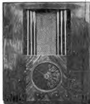
Prezzo di listino L. 1350

Nei prezzi sottostanti è inclusa la tassa radio ma escluso l'abbonamento all'E.I.A.A.