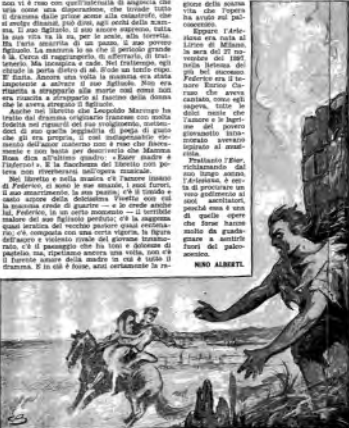
Dis. di Carlo Savini.