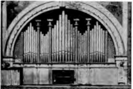
La Basilica di San Francesco della quale la Stazione di Palermo trasmette la messa domenicale. La cupola dell'innocenza a Foggia.