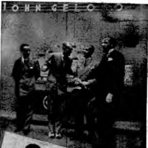
Visita allo Stadio del prodotto Geloso.