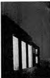
Il partito d'entrata.

In breve, anziché il nuovo concetto di concentrare la potenza sulla poche onde disponibili, nel settembre 1929 si attivavano a Londra (Brookman Park) due trasmettitori da 50 kW - antenna, emettenti l'uno il programma nazionale (London National, onda 301 m.) e l'altro quella regionale (London Regional, onda 342 m.); nel maggio 1931 si attivò un altoparlante trasmettente da 50 kW a Moorade Edge (Northampton, 440 m.); nel settembre 1932 due trasmettitori da 50 kW, a Newington (Southampton, 280 m.) e Droytwich (Droitwich, 212 m.); infine, nell'agosto 1933, le due stazioni da 50 kW, West National (281 m.) e West Regional (297 m.). Con trasmettitori Midland Regional (25 kW, onda 390 m.) sistemati, in un'ora a quello ed onda lunga, si dissestano di governo, in complesso, nell'agosto 1933, otto stazioni di grande potenza ad onda media ed una ad onda lunga.