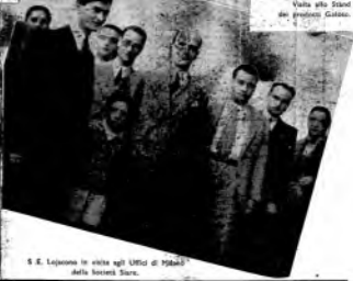
S. E. Lejorano in visita agli Uffici di Piazza Sora della Società Sora.