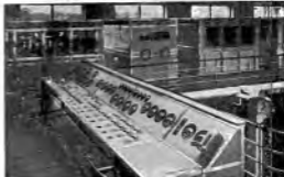
Il banco di controllo.