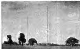
Vista generale della stazione inglese di Droitwich.

Una particolarità dell'impiego di Droitwich è il suo sistema di alimentazione, per cui viene provveduto all'energia di alimentazione. Vi sono cioè 4 impianti idroelettrici ad onda presente da 25 HP, ognuno dei quali può fornire corrente alternata trifase a 50 periodi. Per il trasmettente ad onda lunga, questa corrente viene rettificata in due bracci a diodi a valori di tensione capaci ognuno di fornire 600 kW, a 20.000 V, come è necessario per l'alimentazione degli anodi. Invece, all'alimentazione anodica del trasmettente regionale da 50 kW, viene provveduto per mezzo di due convertitori rotanti da 300 kW, alimentati dalla stessa corrente alternata trifase dai gruppi idroelettrici. I quali però, possono essere accoppiati in serie e fornire, in caso di necessità, la tensione anodica ai trasmettenti ad onda lunga. Altro macchina