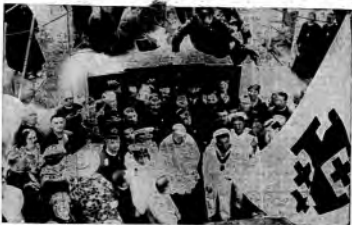
Due dei due pionieri radiofonici del posto consegnato effetto dell'Esar e che data dalla il viaggio in Terra, ma si trova questa fotografia presa mentre, alla presenza dell'Arcivescovo di Anagni, la bandiera crociata sta per issare nell'Esar; la magnifica mano dei poliziotti in partenza verso la terra della Redenzione.

Una cosa seria, cioè l'antico, totale e totale del radiodiffusione di cui Marinetti, con la sua energia parata ha fatto giustizia dimostrazione futurista, futurista, il futuro è sempre e sempre. In fondo era naturale la gran linea proiettata dei padri latini, aveva solo in surplus e solo. E il futurismo, che tende a vittimizzare il nostro modo di vivere, a perfezionare il corpo umano, ad addormentare il corpo ed al meglio della macchina, a prepararlo alla grande civile occasione dell'avvenire, è una magnifica espressione del futurismo. « Noi pensiamo — ha detto R. E. Marinetti — ad una realtà concreta che utilizzi tutte le forze della natura, che lanciando corpe viventi costituisca un motore. Vi sono degli spiriti eterei nel mondo che spermiplano i sensi per raggiungere in loro. Ci si trova. Altri tentano il volo laterale umano. Si volerà con ali nate, perché lo spirito domina la materia ed il corpo è permissibile a forza di cervello. Questo materialismo futurista, voluto da Mussolini, si imporrà agli altri ».