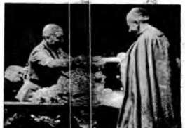
Un coltivatore l'uccisione, Roma, Colonnello, viene dal Duce il primo ministro.