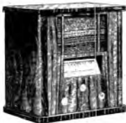
SUPER 5. V. 2. Midget