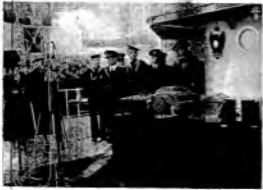
I attori recitanti la Ballata di combattimento durante il 4 dicembre della città di Aigi, Alessandria, Como e Como al castelottoriano Felgore, Rabbio, Lompe e Felina.