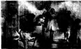
« Gran Orchestra » (Rit. Canadian) e la « Orchestra » della « Leggende delle Parche ».