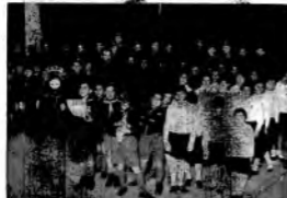
Il Balilla e la Piccola Italiana della Scuola di Musica di Genova al microfono per l'attuazione del programma scolastico del 12 novembre scorso.

Nelle radiostazioni Antico celebrato il primo centenario dello scienziato di Borodin, il cui nome è legato non solo ad opere celebri — come il principe Igor, Nella stampa dell'Atto eccelsa, ecc. — ma anche a quel famoso e gruppo di giovani che sono liberati in maniera reale dalle angosce straniere. Il cinque erano Borodin, Mendelgaj, Balabren, Col. Rimsky-Korsakov, e tutti servivano alle scienze delle arti e della musica. Borodin era medico, chimico, professore e scienziato, tanto che temeva che la sua vita fosse un continuo dolore, ma non aveva scartato. Alzavak era il figlio di marina; Mendelgaj ufficiale delle guardie. Col professore di fortificazioni. Si definiscono i compositori da parole di fantasia, e i contemporanei il obiettivamente un grande «muskvlov» (un modo di solidificarsi). Orbene, furono questi uomini che salvarono e salvaro coloro la musica russa. Loro, dopo aver servito, nel 1880, in Siberia in un battello di Borodin, gli scriveva: « Per anni di Dio, non combinate mai nulla! Il nostro spirito musicale è tale che non dovete aver paura di essere originali e di farvi scrivere: e dovete aver del bisogno di cercare la vostra Russia. La respirare ».