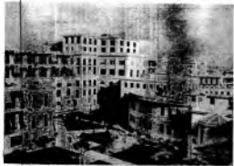
Le opere del Regime: il Centro Sperimentale e Benito Mussolini.

roto, e l'officina intrata, delle previsioni estive e invernali. Sono, questa, tutte presenze, ma non basterebbero, ed ecco, nella luce di Roma, sorgere questa recalcitrante della nuova era, questa Centro Sperimentale pieno di una serie di istituti consimili, che non ha uguali al mondo e dove una folla di medici impugna una laurea e benedice la guerra contro la tubercolosi. Tutto il battaglia impegnato dal Fascismo al condimento con la vittoria e così sarà anche per questa battaglia che fa parte della stessa crociata intrepida contro ogni forma di peccato che possa incidere la salute della gioventù e, quindi, lo sviluppo vigoroso del popolo.