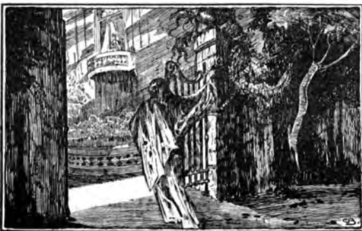
« Goyescas » di Granados - Epilogo: lo spettro di Fernando.