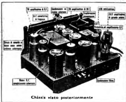
Chassis visto posteriormente

L'indicatore di sintonia è del tipo ad ombra, cioè il più moderno.