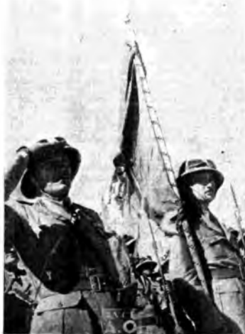
La gloriosa bandiera della «Gran Sasso»

L'oro italiano, consacrato dal coraggio, dalla fede e dalla povertà, non serve a scopi obliqui, ma si trasforma in armi e strumenti per conquistare alla civiltà nuovi territori che un popolo operoso ha il diritto ed il dovere di mettere in valore.