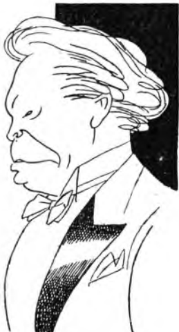
S. E. Ottorino Respighi

Degna cosa è incominciare col nome di Ottorino Respighi la stagione sinfonica che l'Eiar offre ogni inverno. Il venerdì sera, ai suoi abbonati del Teatro di Torino.