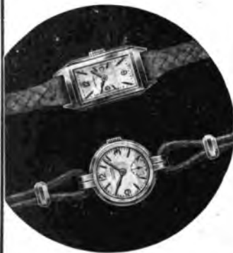
Modello per Signora

Tutto quanto è stato conquistato durante secoli di esperienza, nel campo dell'industria orologiaia: precisione, robustezza, eleganza, prezzo, si trova riassunto nell'orologio