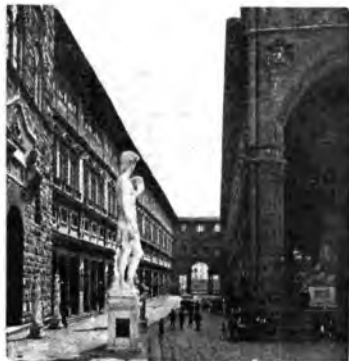
Portici degli Uffizi e la copia del David di Michelangiolo.

Ferdinando I vi trasportò statue e quadri da Roma e costruì, nel 1610, la cosiddetta Tribuna; Ferdinando II aggiunse nuovi locali per custodire le opere ereditate dai Della Rovere, mentre suo fratello, il Cardinale Leopoldo, fondava la raccolta dei ritratti e dei disegni. Cosimo III ha il merito di aver donato agli Uffizi la Veneranda e della dei Medici. L'ultima discendente di questa famiglia, Anna Maria, oltre ad aggiungere la collezione dei