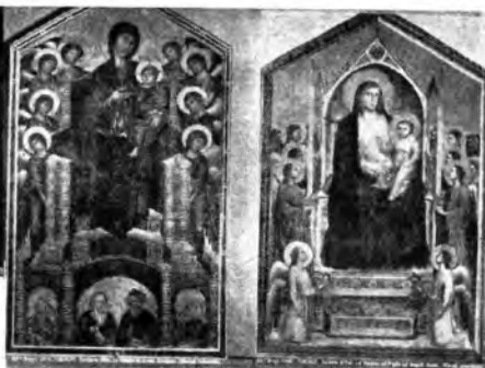
Annunciazione della Vergine di Simone di Martino e Lippo Memmi; La Vergine in trono di Cimabue; La Vergine col Figlio di Giotto; Battaglia di Paolo Uccello.

Venerdì 8 maggio l'illustre conversatore parlerà sul tema: « Firenze, la Scuola Toscana e la Scuola Umbra ». Successivamente, nella seconda conversazione di venerdì 15 maggio, parlerà della Scuola Veneta e della Scuola Ferrarese e nella terza, venerdì 22 maggio, della Scuola Fiamminga e gli autoritratti. Le tre conferenze s'intizieranno alle ore 20.35 dei giorni stabiliti.