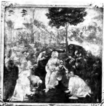
L'Adorazione dei Re Magi di Leonardo da Vinci.

N el mese di maggio gli ascoltatori, nei quali persiste il grato ricordo delle conversazioni sull'Arte recentemente concluse, avranno la lieta sorpresa di essere guidati dalla parola del pittore Baccio Maria Bacci attraverso la Galleria degli Uffizi di Firenze. La Città del Fiore e dell'Arte che, in maggio, esaltando e celebrando con riti speciali di poesia la primavera, sembra esultare e celebrare il suo perenne fiorire, possiede nella celebre Galleria un glorioso sacro di pittura e di scultura che basterebbe da solo a formare l'orgoglio artistico di una Nazione. Opportunamente il Bacci ha suddiviso la sua rassegna dei tesori d'arte custoditi agli Uffizi in tre conferenze, raggruppando la materia d'indagine in associazioni omogenee.