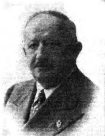
Il senatore prof. Francesco Valsugha ha concluso il ciclo di conversazioni per gli insegnanti elementari organizzato dall'Ente Radio Rurale

Un ingegnere americano ha costruito la più piccola trasmittente del mondo. Essa pesa, si dice, 400 grammi e difonde in un cerchio del raggio di sei chilometri. Nelle colonie francesi si contano ben 113 piccole trasmittenti locali.