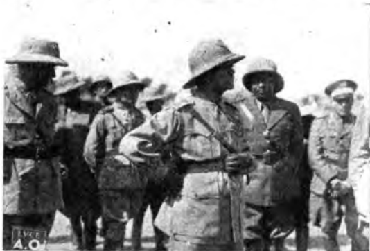
Il Maresciallo Badoglio.