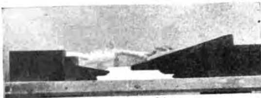
Scena per l'«Edipo a Colono».