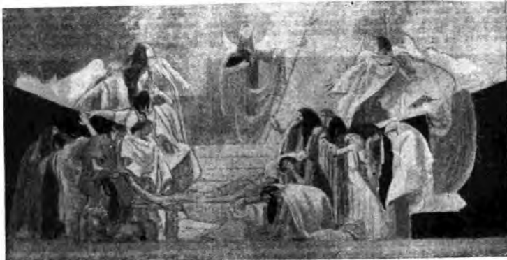
Apparizione di Artemide nell'«Ippolito».

Duilio Cambellotti ha chiuso nella cornice rievocatrice di una scenografia realistica il dramma passionale, e Giuseppe Mulè lo ha musicamente commentato, riuscendo ad unire agli antichi modi melodici la sua sensibilità che interpretando il passato interpreta anche il presente, perché le passioni umane sono eterne ed immutabili. Ippolito sarà eseguito nel magnifico teatro di Siracusa, che sorge sul colle Temenite.