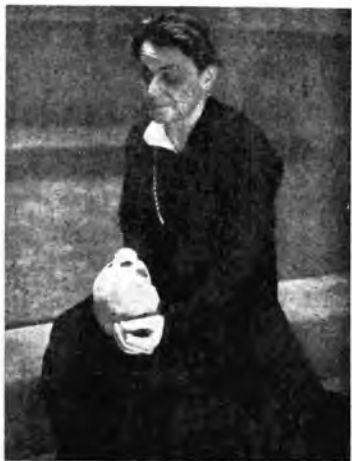
Uno degli ultimi interpreti italiani di Amleto: Alessandro Moissi

Ma quando, precipitosamente, per volontà del Re, al quale sembra che tutti gli occhi frughino nell'animo, la rappresentazione è troncata, e Amleto ha la sicurezza di essere svelto, che non era nella sua intuizione, l'ombra e non era il diavolo) non ha mentito, che lo zio, complice