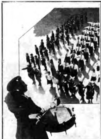
FOTOGRAFIA VINCENTE IL PRIMO PREMIO DEL PRIMO CONCORSO FOTODIOFONICO « FERRANIA »

Tema: «Le Organizzazioni Giovanili del Regime».