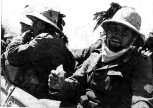
Bersaglieri della colonna celere.