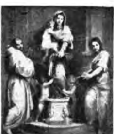
La Madonna del Cardellino di Raffaello Sanzio; Ritratto di Lucrezia Pucci di Angiolo Bronzino; La Primavera di Sandro Botticelli; Venere de' Medici; Madonna detta dell'Arpie di Andrea del Sarto