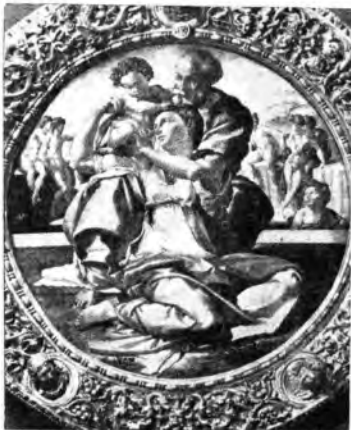
Santa Famiglia di Michelangiolo Buonarroti.

Sarà dunque una visita vera e propria alla famosa Galleria con la guida di un autorevole e competente illustratore: per favorire l'orientamento degli ascoltatori, che per loro disgrazia non hanno mai visitato l'insigne luogo, diamo qualche cenno illustrativo di esso.