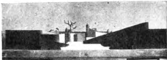
Scena per l'«Ippolito».