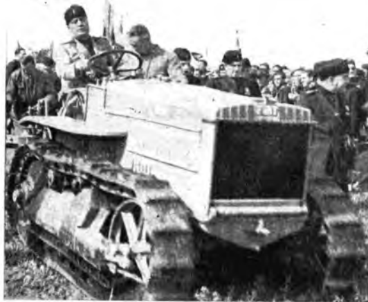
Il Duce traccia il solco di Aprilia nell'Agro redento.

Aperto sotto il cielo del Lazio, come una benedetta, benefica ferita, quel solco lascia che esalino verso il sole le arcane voci della terra madre, carica di ricordi, saturata di esperienze, memore e viva: e sono voci di grandezza, voci di gloria, voci di impero.