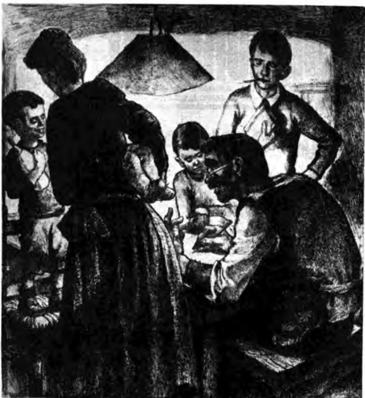
In famiglia: il giorno del censimento (Disegno di Beppe Parcheddu)

Tutti coloro che versarono il loro sangue nel nome d'Italia hanno diritto ad essere rammentati, ed onorati, qualunque sia l'entità delle forze impegnate. Concetto che è ribadito dal generale Bollati, il quale ha saputo riassumere con chiarezza e precisione, attraverso quell'imponente massa di combattimenti, ciò che vi fu di drammatico e di veramente eroico nella nostra storia coloniale che ha militarmente onore a quanti tutto dettero di sé con fede e con entusiasmo superati solo dall'amore per la Patria che, per i suoi figli, non abbastanza conscia, o troppo spesso indifferente, perché corrosa dal male civile che ne declinava la volontà costruttive ed espansive.