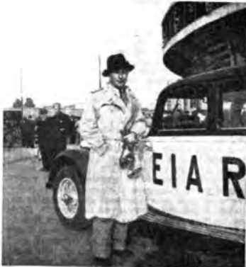
Giro d'Italia: La partenza da Milano.

In America esistono strane sette religiose. La Chiesa protestante di Detroit, per i riti della « Conoscenza riformata » si trova davanti a un bel caso. Due giovani sposi, abitanti a Meruuen, avevano chiesto di aderire alla setta, ma la loro domanda fu sdegnosamente respinta « perché i postulanti posseggono un apparecchio radio ». Il Consiglio della Co-