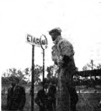
I cronisti dell'Eiar al Giro d'Italia.

Il Regime ha scelto la fatidica data del 24 maggio, che ricorda il generoso intervento dell'Italia, scesa in campo a fianco degli ex-alleati, oggi nazionalisti per accogliere nelle sue formazioni le falangi primaverili della Lupa fascista che ogni anno imprecita nelle file del Balilla, degli Avan-