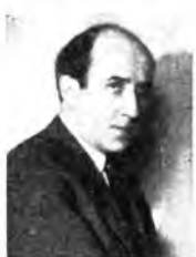
Il concertatore Maestro Alfredo Alessandrescu

La Romania è un paese squisitamente musicale. Nelle sue abitudini, come nel suo lavoro, in ogni manifestazione di gioia o di sofferenza, il cittadino romeno non sa prescindere dal canto. Si tratta di una musica tutta propria che ha per carattere la nostalgica tristezza legata allo spirito della razza e ai sentimenti del popolo, travagliato nei secoli da acute sofferenze dotate a pesanti dominazioni straniere ed a frequenti invasioni barbariche.