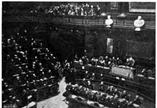
Le sedute della Camera e del Senato nelle quali furono solennemente approvate l'annessione dell'Etiopia e la fondazione dell'Impero.