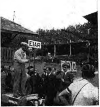
Giro d'Italia: L'arrivo a Torino.