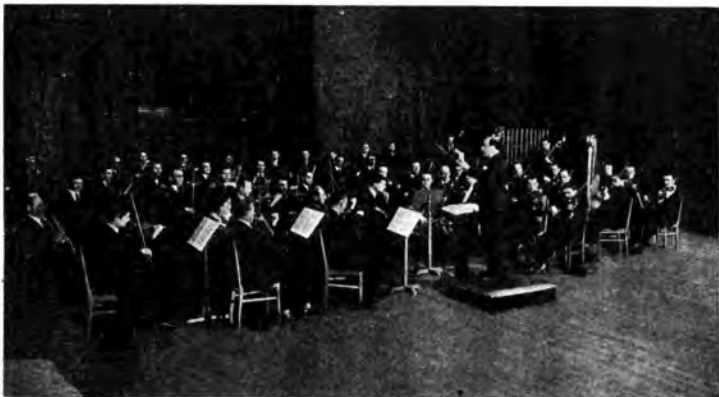
Orchestra Radio Bucarest diretta dal Maestro Alfredo Alessandrescu