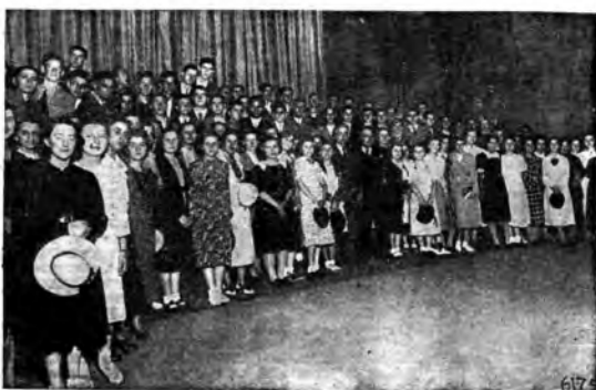
Piccole Italiane e Avanguardisti sul palcoscenico del Teatro «Eiar» di Torino.