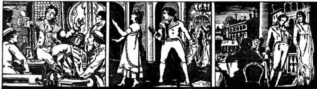
«I racconti di Hoffmann» di Offenbach.