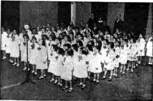
La Scuola «Generale Magliocco» nell'auditorium della Stazione di Palermo.

La caratteristica più interessante della trasmissione è la vecchia casa di Champagnelle, da parte delle Stazioni federali francesi, è stata che essa fu esecuita con l'ausilio di vecchi strumenti automatici e di scatole musicali autentiche. Tutti con oltre un secolo di anzianità. Una bimba vien portata dalla vecchia zia in una casa di famiglia, sperduta nella