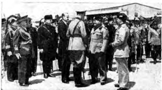
Il Duce riceve all'Aeroporto del Littorio il Maresciallo von Blomberg.