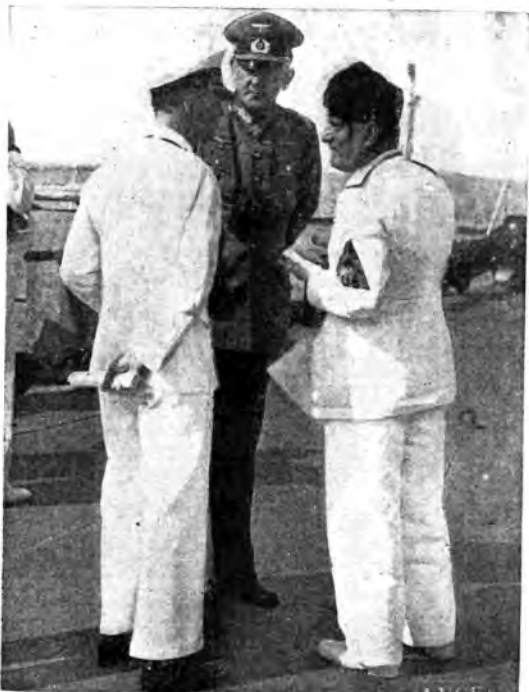
Il Duce e il Maresciallo von Blomberg alla grande rivista navale.