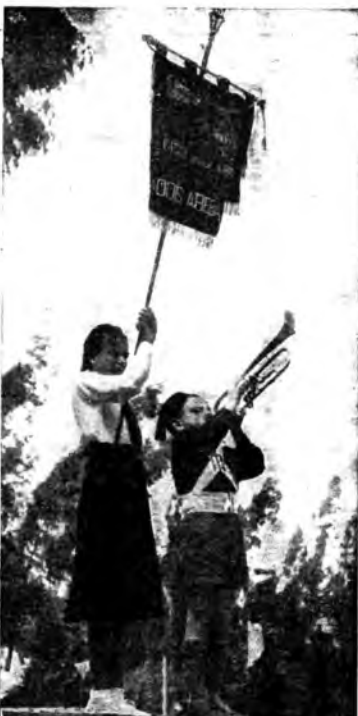
La Leva fascista di Addis Abeba: l'adunata suonata dal trombettiere Figlio della Lupa.

La N.B.C. americana, avendo aggiunto altre sei trasmissioni alla sua catena, viene ora a possedere centonovequattro Stazioni — Mosca progetta di costruire il più grande studio del mondo che compren-