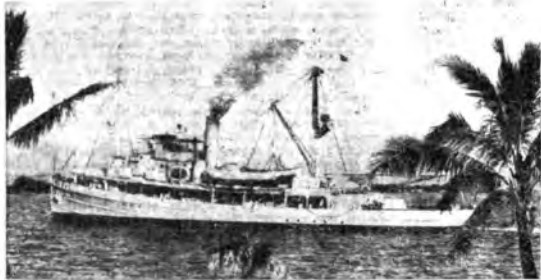
L'«Avocet» lascia Pearl Harbor con i membri della spedizione scientifica incaricata di osservare e studiare il grandioso fenomeno solare.

Inutile dire che anche il sole fu... puntuale all'appuntamento astronomico che venne controllato e commentato dai microfoni, alleati dei telescopi