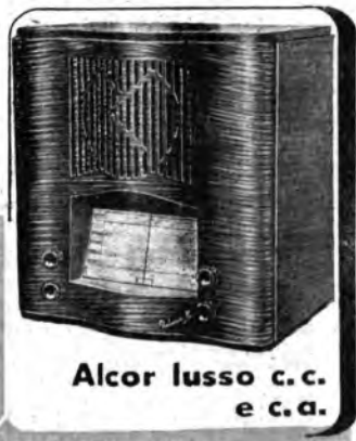
Alcor lusso c.c. e c.a.

Multiplicato di sintonia - cambio gamme d'onda - Regolatore di volume e interruttore 2,6 Watt - Controllo automatico di sensibilità - Mobile acusticamente studiato - assorbe 64 V.A. - 6 novità assolute (Brevetti Magnet Marolli) - Telaio monoblocco "permanenti" - Trasformatori media frequenza in "poliferro" - Scala policroma - 6A7 - 42 - 75 - 78 - 80 - Alimentazione in corrente alternata per tensioni 105 e 200 Volta e 145-270 Volta. - L'Alcor lusso tipo speciale a corrente continua 100/250 Volta; inoltre ha le seguenti valvole FIVRE: 6A7 - 78 - 6B7 - 43 - 25 Z 5.