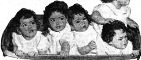
Diritti riservati nel mondo. Ogni riproduzione vietata.