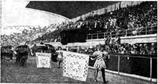
Il Carosello di Napoli che si è svolto nel primo annuale dell'Impero alla presenza dell'Augusto Savrano, è stato una festa d'armi, un'apoteosi coreografica delle glorie militari italiane dai cavalieri del Conte Verde ai Legionari del Littorio.