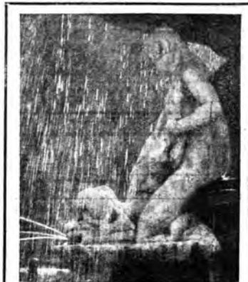
Fotografia vincente il Primo premio del 2° Concorso fotografico ferraniano

14:52: m 331.9; kW 100 18:15: Musica da camera. 18:45: Bollettini vari. 19: Concerto vario. 19:45: Attualità - Notiz. 20:10 (da Hannover): Concerto orchestrale e concerto di Harand; Concerto grosso in sol min.; 2. Cantor; 3. Respighi: Un frammento della Fiamma (reg.); 4. Beethoven: Un frammento del Fidelio (reg.); 5. Brahms: Sinfonia n. 2 in re maggiore op. 73. 22:30: Notiziario. 22:30-23: Mus. da ballo. BERLINO 14:52: m 356.7; kW 100 18: Come Francoforte. 19: Attualità varia.