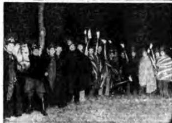
« I giganti » con le fiacche al finale del mito.