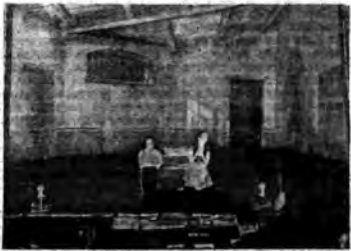
La Camerata del Balilla e delle Piccole Italiane ha esecuito al Teatro Dal Verme « Gino e Mimì », graziosa fava di G. Testi musicata da L. Savina.