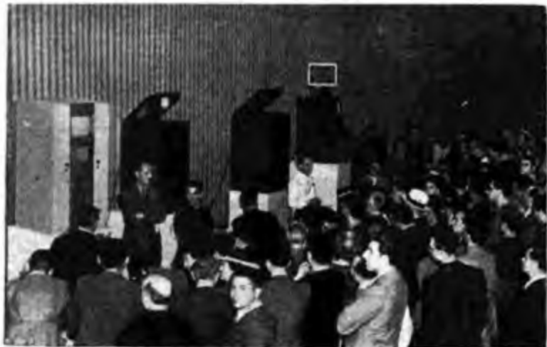
Il pubblico davanti agli apparecchi fenotelevisivi.

Di queste trasmissioni, che si prolungheranno sino al 26 agosto, daranno successive notizie.