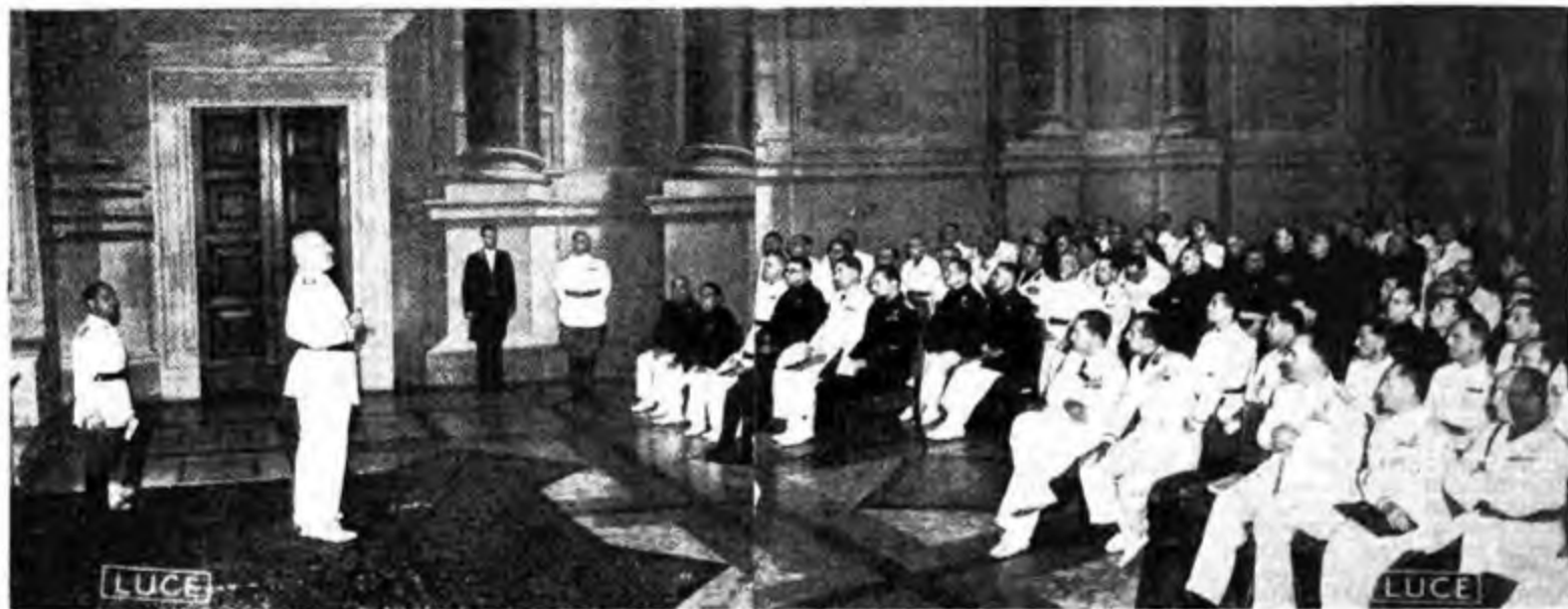
Lo storico rapporto tenuto nella Sala delle Battaglie a Palazzo Venezia: il Duce, presenti i Ministri, annuncia alle Gerarchie della Sicilia che il latifondo sarà liquidato dal villaggio rurale.

E' una nuova risposta pacifica e laboriosa che l'Italia Fascista personificata dal suo Duce dà al bellicismo democratico. Sarà intesa? Comunque, la storia della civiltà la registra sin da oggi, all'attivo del Fascismo che non conosce passività e che mentre lavora e opera, si agguerrisce e vigila sempre pronto se occorra a scendere in campo per difendere le sue conquiste, ad un cenno del suo Duce.