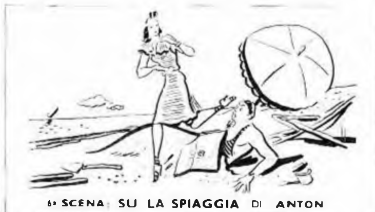
6ª SCENA SU LA SPIAGGIA DI ANTON

DOMENICA 30 LUGLIO 1939 - Anno XVII - ORE 13,15