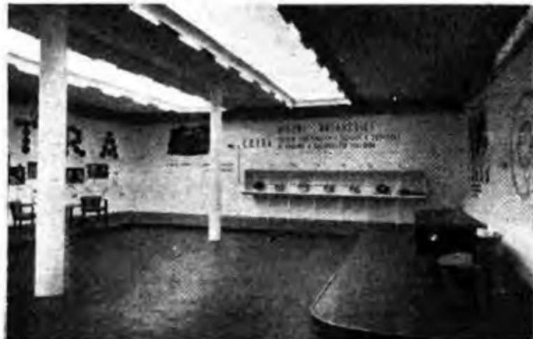
Il posteggio della Cetra al Villaggio Balneare di Roma.