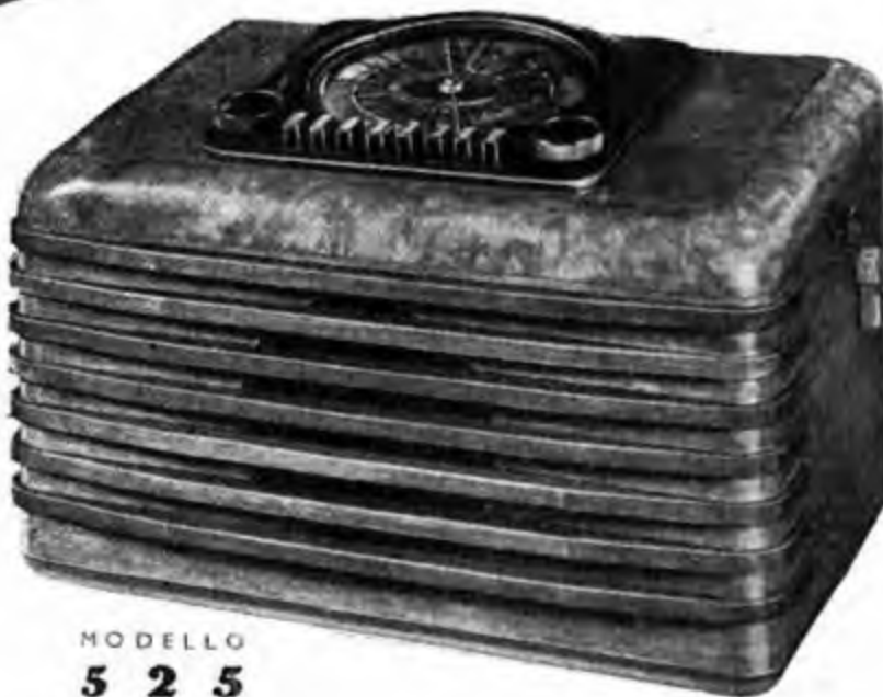
MODELLO 5 2 5

SERIE TACHISINTOGRAFO VOCE PHONOLA ANTENNA AUTOMATICA CONDENSATORI DUCATI VALVOLE ROSSE