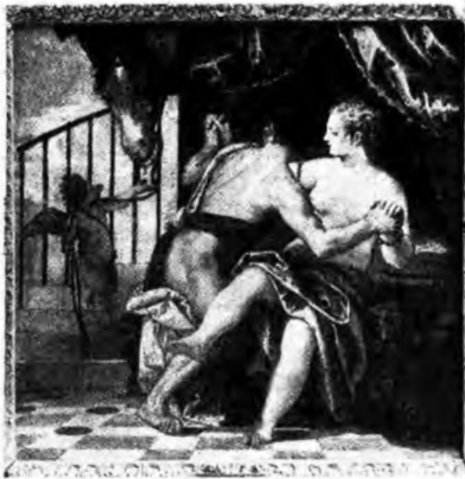
Venere e Adone (R. Ambasciata d'Italia - Londra)

25 APRILE - 4 NOVEMBRE 1939-XVIII ● RIDUZIONI FERROVIARIE