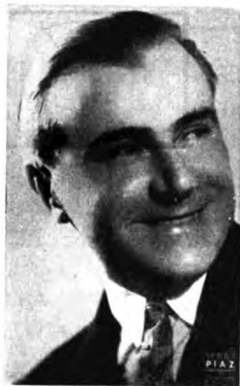
Tenore Giuseppe Lugo

Un radiotecnico italiano — seconda informo. La Scienza per Tutti — nel n. 3 — ha realizzato un piccolo apparecchio radiocentrico per bicicletta. Con lo sviluppo che ha preso la bicicletta era logica e giusto che qualcuno pensasse ad alleviare la fatica del pedalatore con un pochino di musica leggera. Allestire e far dimenticare la fatica perché, secondo informazioni che ci trasmettono gli paleontologi, la radio oltre ad aumentare sensibilmente il rendimento del lavoro fisico, fa anche dimenticare in grande parte quella stanchezza che è logica conseguenza di ogni lavoro muscolare. L'apparecchio impiega due vetrolibri di cui una rivelerisce a reazione ed una amplificatrice a bassa frequenza. Esso può ricevere in cuffia la locale e qualche stazione lontana fra le più potenti. La parte più interessante di questo ricevitore consiste nell'impiego del telaio della bicicletta come antenna ricevente e della cassetta contenente il ricevitore e dei collegamenti alla cuffia come contrappeso. La custodia dell'apparecchio opportunamente sagomata, deve essere isolata dal telaio: basta quindi uno spessore di gomma para per ottenere l'intento. L'apparecchio ha tre comandi: l'interruttore, il condensatore di sintonia e il regolatore della reazione. L'attenuazione è ottenuta attraverso delle normali pelli incluse nella custodia.