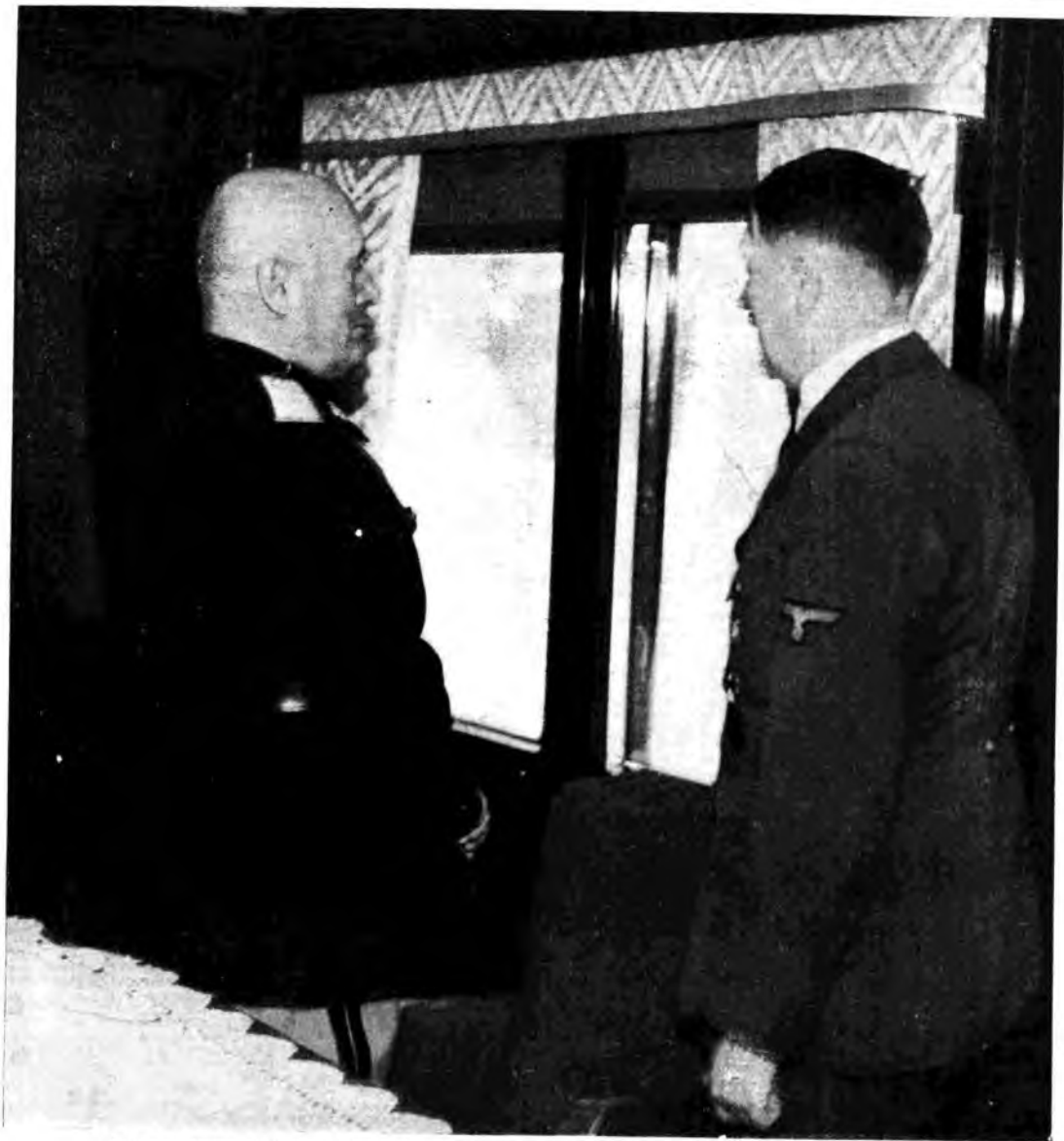
Lo storico incontro di Mussolini e Hitler al Brennero, il valico alpino che separa nettamente due Stati e unisce due Popoli.

SETTIMANALE DELL'EIAR - DIREZIONE E AMMINISTRAZIONE: TORINO - VIA ARSENALE 21 - TELEFONO N. 41-172 ABBONAMENTO ANNUO: ITALIA IMPERO E COLONIE LIRE 33 - PER GLI ABBONATI ALL'EIAR LIRE 27 - ESTERO LIRE 75 PUBBLICITÀ SOCIETÀ SIPRA - TORINO - VIA ROMA N. 24 - TELEFONO N. 53-425 - UN NUMERO SEPARATO LIRE 0,70