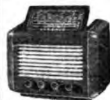
1° Premio uomini: Apparecchio Radiofono Fono Di. 508

Tutti possono partecipare al concorso «5000 Lire... e un Corredo per un sorriso» inviando una propria fotografia con viso sorridente del formato minimo 13 x 18 a GI. VI. EMME - Rivista Grazia - Via Ronchetti, 11 - Milano