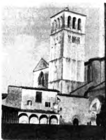
La monumentale Basilica di San Francesco.

Alla vigilia della partenza per l'America del Nord, ore disputerà l'ormai famoso «Gianto d'Oro», la rappresentativa pugilistica europea ha incontrato martedì 19 marzo al Circo Massimo in Roma i dilettanti italiani Organizzata dalla S. S. Parioli la riunione è stata come al solito, interessantissima. L'Eiar ha diffuso sulle stazioni del Terzo Programma le fasi movimentate degli ultimi incontri con una radiocronaca diretta da Mario Ferretti.