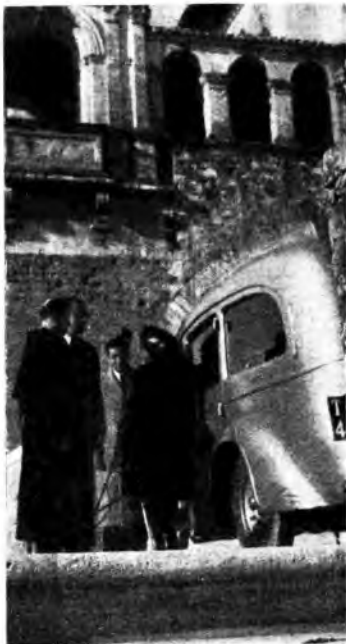
I cronisti e la vettura-radio dell'«Eiar» ad Assisi.

Il tramonto trova il microfono nella grande sob-