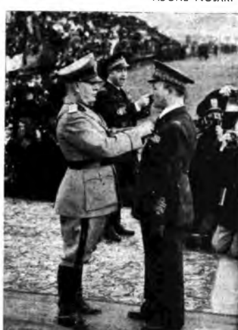
Il Duce consegna le medaglie d'oro al valor militare al maggiore pilota Ettore Muti, Segretario del Partito, al generale Pricolo, Sottosegretario dell'Aeronautica, e al generale di Squadra aerea Aurelio Liotta.