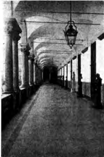
L'ampissimo cortile di forma quadra circondato in due parti da un doppio ordine di portici, sede dell'Accademia Militare di Torino. È stato fatto costruire da Carlo Emanuele II su disegno del conte Amedeo di Castellamonte.

Sempre in cerca di nuove impressioni i microfoni dell'Eiar instancabili passano da un genere all'altro, da una località all'altra. Stanno infatti ora raccogliendo fra l'altro materiale per presentare alcuni quadri della semplice, dura e perigliosa vita dei pescatori di corallo a Torre del Greco, le serene ed un po' nostalgiche scene della vita che i vecchi nostri attori drammatici passano fra le accoglienti mura della Casa di riposo per gli artisti a Bologna, e la documentazione della dinamica vita segreta del Centro Assistenza Volo che da Ostia si prodiga per contribuire a dare sicurezza alle ali d'Italia nei loro arditi voli.