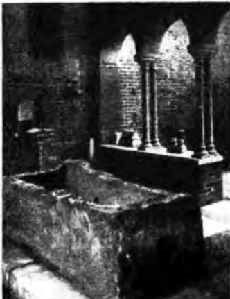
La tomba dove sarebbero stati sepolti a Verona, Giulietta e Romeo.