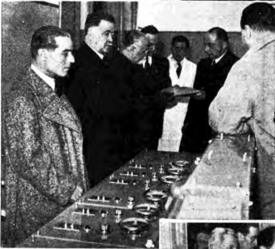
La visita agli impianti.