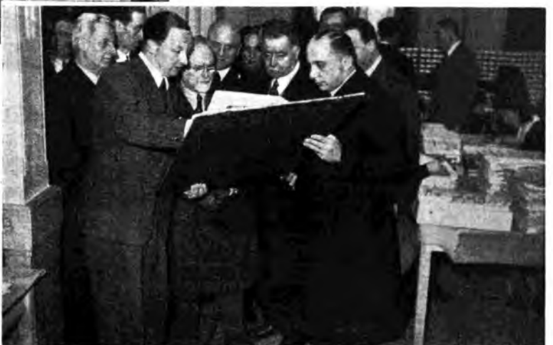
Negli uffici dove si raccolgono i dati statistici del « Referendum ».

Il Sottosegretario al Ministero delle Comunicazioni e l'Accademico Pession, ammirata la complessità del lavoro che ormai volge al suo epilogo, si sono compiaciuti degli interessanti risultati ai quali la felice iniziativa è pervenuta.