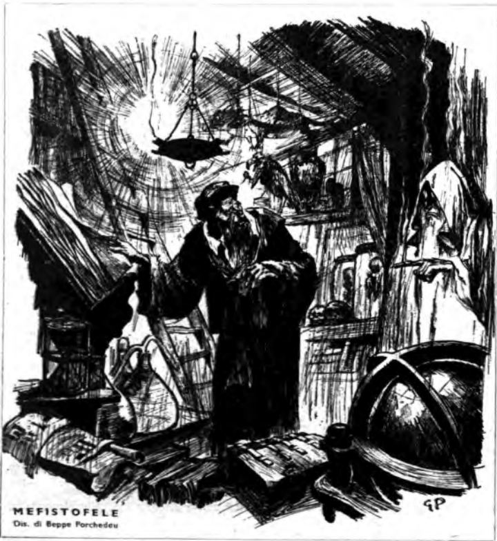
MEFISTOFELE Dis. di Beppe Porchedeu

Boito copia egli stesso le parti dei cantanti principali e secondari, perché non si fida dei copisti «stante l'aspetto più che sibillino — egli scrive — in cui si trova ridotta la mia partitura per causa delle modificazioni che le feci subire». Larghi lagli senza pietà sono stati infatti operati al primo Mefistofele (alla Scala era durata quasi sette ore) e molte varianti introdotte. Soppressi interamente l'atto del Palazzo Imperiale e l'intermezzo della Ba-