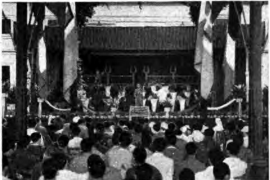
Gerarchi del Partito, del Doppolavoro, del Ministero Cultura Popolare e Funzionari dell'«Eiar» tra i feriti alla rappresentazione data da un complesso di varietà dell'«Eiar» nell'Ospedale Militare del Celio a Roma.