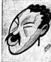
Uno dei «presentatori» di Radio Sociale

dimostrazione che commuove e che riconferma lo slancio del popolo nell'assistenza spirituale e morale ai soldati di tutte le armi e che di essa sono la parte più viva, più sana, più generosa l'Ufficio pacchi di Radio Sociale è in piena attività. Rimessa su rimessa che l'«Eiar» ritrasmette alla Presidenza del Consiglio dei Ministri che ne cura la distribuzione ai Combattenti. Come dai nostri