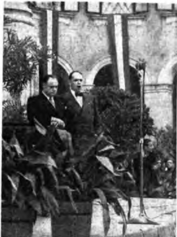
Il concerto vocale degli artisti del Teatro Reale dell'Opera di Lubiana - Beniamino Gigli e Gino Bechi nel duetto dell'atto quarto della « Forza del destino ».

La Radio nipponica ha sviluppato assai il teatro. Dalle dieci trasmissioni teatrali, mensili del 1937 si è oggi alla cinquanta. Uno dei più recenti successi è « Un villaggio di pescatori di Gontoku Kamya, lavoro assai complesso. Altri lavori notevoli sono: Il canto del vecchio castello al chiaro di luna, tratto dal folclore delle isole di Lu-Toku; I bumbi e le quattro stagioni e Un villaggio miscelato da un orso, che descrive la monotona vita