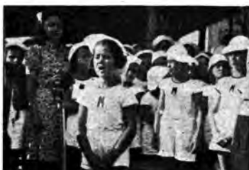
Colonia R. Sapelli