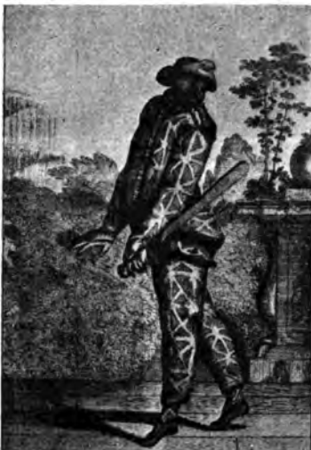
Un Arlecchino della Commedia dell'arte