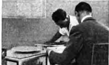
Si trasmettono dischi