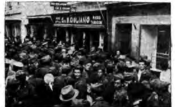
L'ascolto in calle S. Maria