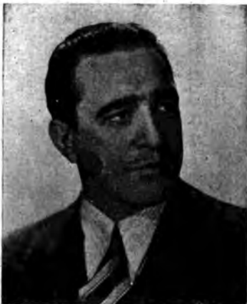
Il tenore Galliano Masini, interprete di Lohengrin