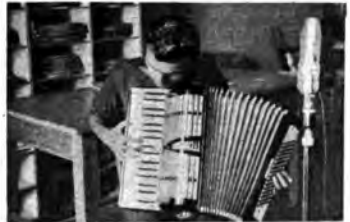
Un giovane virtuoso della fisarmonica