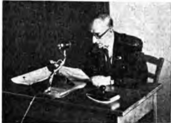
Le trasmissioni in croato delle « Cronache d'imate »