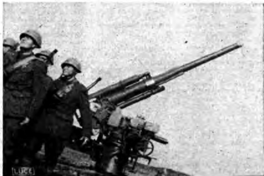
Una postazione di artiglieria antiaerea sul fronte ucraino.