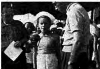
La trasmissione dalla