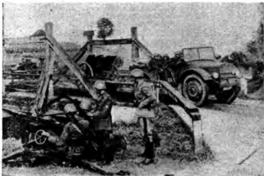
Le nostre truppe al fronte ucraino: postazione antiaerea a protezione dell'avanzata.

La Russia — il cui popolo sarà presto liberato dall'oppressione di una piccola schiera di negatori