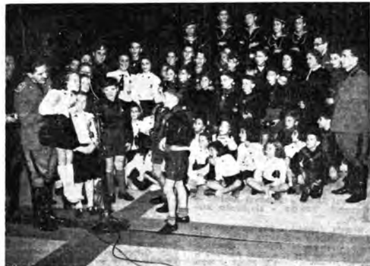
La trasmissione di Radio Gil da Trieste: Un pensiero e un bacio al babbo combattente