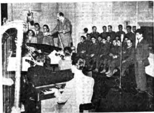
Un gruppo di feriti in ascolto in un auditorio dell'« Eiar » della trasmissione per le Forze Armate.