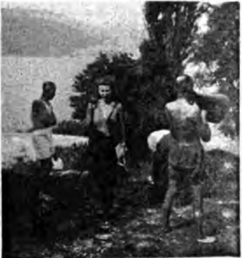
La ricorrenza dell'Esercito nella bellezza armoniosa di Piediluco.

Poiché il programma economico in sede domestica, si compone di tanti piccoli, utili e preziosi suggerimenti, nella stessa trasmissione sono stati impartiti pratici consigli per il ricupero di vecchi vestiti che possono essere ripristinati e ritornare scrivibili, permettendo, anche a costo di qualche rinuncia all'eleganza, delle utili e necessarie economie. Anche il problema alimentare, uno dei più attuali, è stato oggetto di pratici consigli. Il consueto « Calendario e comunicazioni » ha fornito il notiziario del Partito. Un piacevole brano musicale ha alleggerito la trasmissione. Il prossimo appuntamento radiofonico con le ascoltatrici è fissato alle ore 12.45 del 15 novembre.