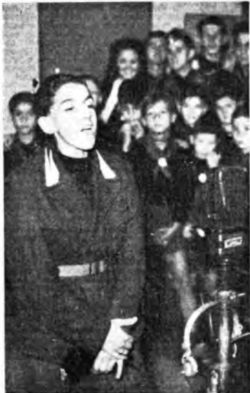
La trasmissione della Gil da Trieste: La canzone di Pieno

I giovani ascoltatori di Radio Gil esprimono spesso il desiderio di entrare attraverso le radiotrasmissioni nel misterioso e appassionante mondo della scienza. Perciò molte volte vengono presentati nelle trasmissioni di Radio Gil interviste o radice-scienze dedicate ai più curiosi fenomeni astronomici, ai più recenti della medicina o della chirurgia; sabato 25 ottobre per esempio è stata trasmessa sotto forma di racconto sonoro e stregoiato, la descrizione del più terribile cataclisma geologico dopo il Diluvio universale: l'eruzione del vulcano Krakatoa avvenuta nel 1883. Ogni sabato, da qualche settimana, la trasmissione di Radio Gil ha inizio con un breve commento a qualche frase del Duce. In occasione dell'anniversario della « Marcia su Roma » è stata trasmessa pure una breve rievocazione e sono stati eseguiti alcuni Inni col concorso di cori e fanfare di organizzati del Comando Federale di Roma. In collegamento con tutte le Stazioni italiane e croate, è stata effettuata la seconda trasmissione speciale dedicata alla gioventù ustasica. In tale programma è continuata l'illustrazione dell'organizzazione della Gioventù Italiana del Littorio; è stata rievocata la « Marcia su Roma » e sono state eseguite numerose canzoni da parte di cori di Balilla, Piccole Italiane e Giovani Fascisti. Duecento Balilla Moschettieri, Tamburini e Trombettieri del Comando Federale dell'Urbe hanno pre-