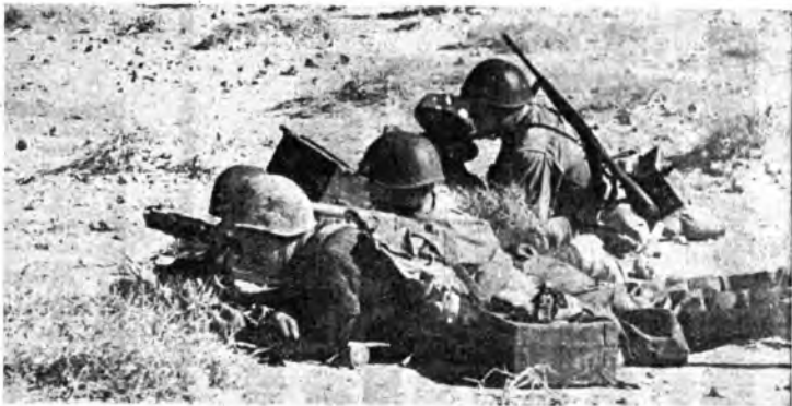
L'operatore Livio Dall'Aglio in linea di guastatori.

Domenica 2 novembre i dialoghi di Radio Rurale tratteranno di particolari tecnici inerenti alla buona vinificazione.