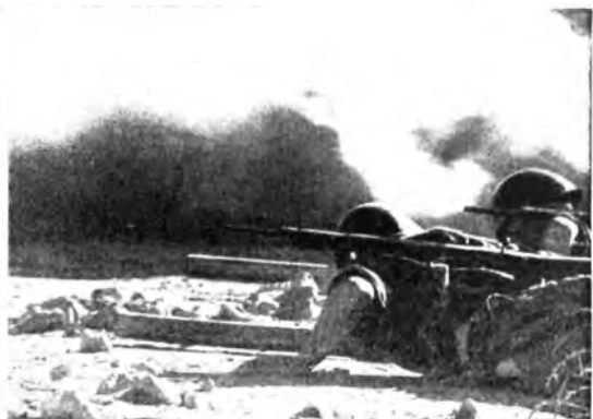
Nella battaglia della Marmarica i nostri guastatori si coprono di gloria attaccando e demolendo le opere fortificate del nemico.