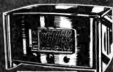
Mod. 110 D.