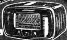
Mod. 110 C.