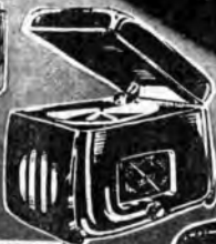
Mod. 109 F.