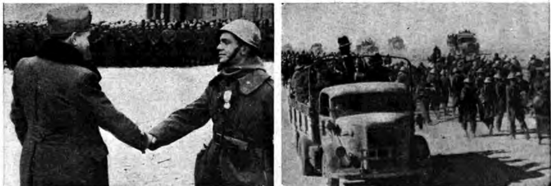
Due momenti diversi di uno stesso epico sforzo vittoriosamente compiuto: in Russia il generale Messe premia con i segni del valore ufficiali e soldati; in Marmarica le nostre colonne motorizzate, affluenti verso la prima linea, s'incrociano con lunghe file di prigionieri inglesi avviiati verso le retrovie.