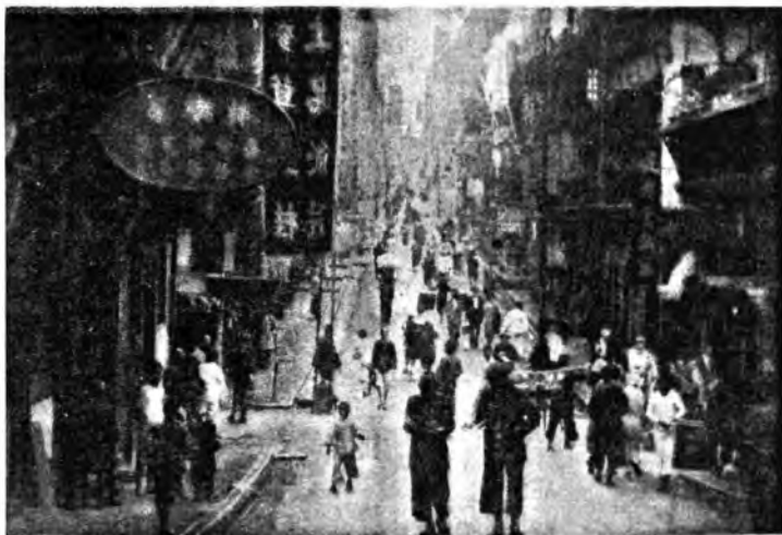
Una pittoresca via del quartiere cinese di Hong-Kong, la formidabile base navale britannica che le vittoriose forze nipponiche, con impeto irresistibile, spezzando le ultime resistenze, stanno liberando dal secolare dominio inglese. (Luca)

ogni giorno mille prove, mille episodi come quello così commovente ed umano della madre di un eroe, che ha donato ai combattenti il cuscinetto sul quale il figlio, caduto in guerra, aveva pesato per tanti anni il capo nel riposo della notte. Chissà quante volte quella mamma si era chinata su quel giuocante a benedire il sonno del figliolo! Eppure ha donato il cimelio, la cara reliquia perché servisse ad un altro nato di madre italiana, ad un altro soldato. Queste madri, queste spose, queste sorelle così vicine ai combattenti rappresentano e rafforzano il volto ed il cuore della più grande madre, la Patria che in ciascuna di esse si trasfonde e ne fa le sue annunciatrici, le sue missionarie, anticampane, con la luce che emana dai loro atti pietosi e dalle loro parole affettuose, lo splendido fulgore della vittoria.