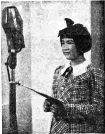
Bambina giapponese che ha parlato alla Radio per le Scuole elementari.

Filippino Lippi squadrava la natura: con tronchi e frappe boschive arreggia una cagnina semidifatta ed eleva un arco di trionfo al Bambinello posato sulle ginocchia della Madre. Avanzano dal