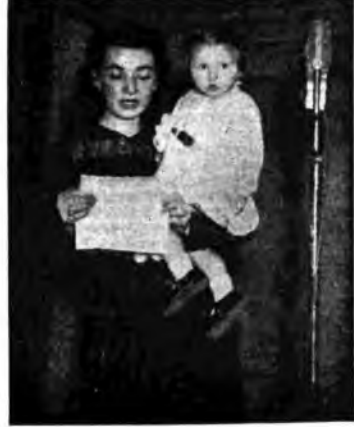
Il saluto delle famiglie ai combattenti.