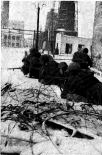
Nel bacino del Donez: La conquista di una zona industriale da parte di truppe del C. S. I. R.