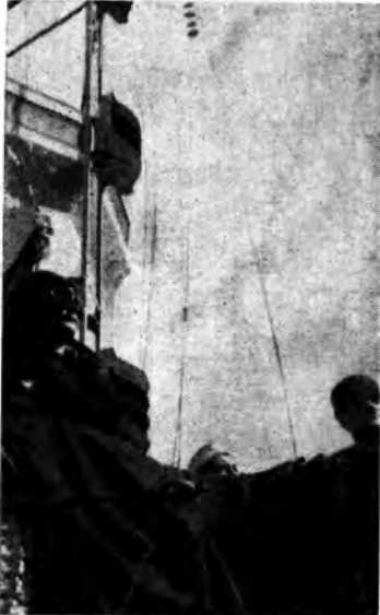
A bordo di una nostra silurante in crociera di guerra nel Mediterraneo