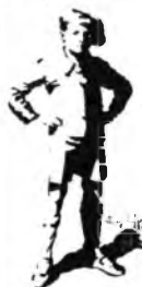
disegno di un Allievo

Molte persone che posseggono disposizioni per il DISEGNO non sono in grado, spesso volte, di trar profitto da queste loro doti preziose. Tra le molte cause che vietano di seguire lo studio del disegno e di godere dei sicuri vantaggi che tale studio procura in moltissimi campi delle moderne attività alcune appaiono particolarmente importanti, come ad esempio, il luogo di residenza, privo di Scuole d'Arte e di artisti professionisti, l'impossibilità di seguire in ore diurne istituti artistici, gli impegni professionali e via dicendo.