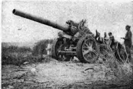
Aspetti e momenti fotografici del fronte libico. — Negli osservatori, sui carri armati, nelle stazioni radio auto-carrate, nelle postazioni di artiglieria la vigilanza è continua, l'azione e la reazione sempre vigorose e prontissime.