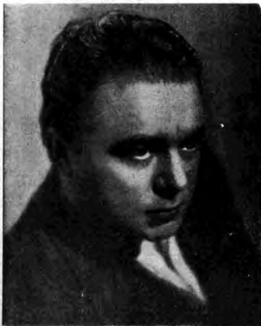
Il tenore FERRUCCIO TAGLIAVINI

EDIZIONI MUSICALI Gora MILANO - Via Cafamatta N. 17 (Nuova Sede)