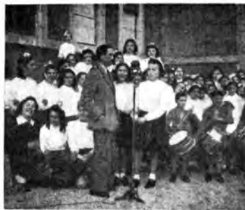
Le fanciulle ospitate nel Collegio della Gile di Monte Mario inviano ai parenti lontani parole di fede e di amore.

« Nella » rubrica dei viaggi » di venerdì scorso sono state visitate radiofonicamente tutte le regioni d'Italia e di ciascuna è stato fatto l'elogio che comprendeva uomini e cose, glorie del pensiero e dell'arte. Nella « vetrina di lunedì » con il tenore Sigrinori sotto lo pseudonimo di Clara Brucaccia, il conduttore dal presentatore, ha cantato una romantica signorina che ha voluto restare in incognito. Lunedì è stata effettuata una radiocena di argomento leonardesco intitolata: « Come nacque la Gioconda ».