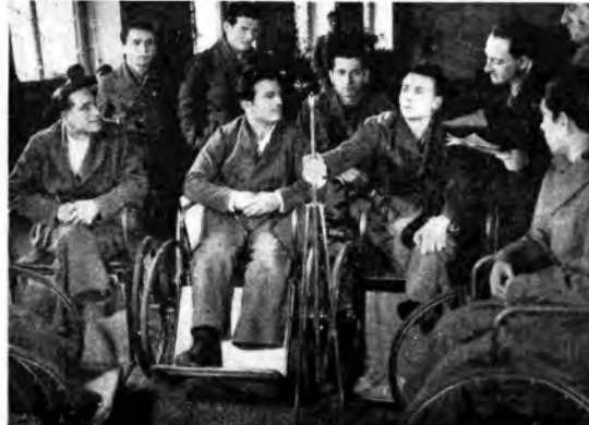
Nella trasmissione di «Notizie a casa» dal Centro Mutilati della Città Universitaria i gloriosi ricoverati salutano le famiglie.