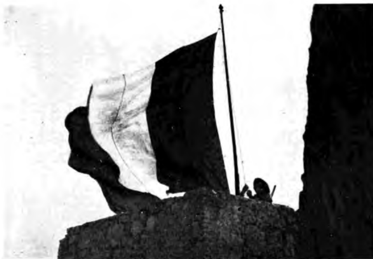
Effetti della controffensiva in Libia. Sul forte di el Mechili sventola il tricolore.

Il Duca d'Aosta ha cercato sempre che la sua vita, segnata dal destino con il suggello del sangue regale, traboccasse nella vita piena di moto, di ardore nativo, di irrequietezza spontanea e cordiale, della giovinezza e della speranza umana. Gli umili e i credenti, i sofferenti e i combattenti andavano alla sua forza ed alla sua anima, come si va incontro alla luce del mattino che sale dall'orizzonte: ma non erano solo gli umili a muoversi, era anche lo spirito del Principe umano e italiano che si muoveva incontro a loro. E durante tutta la vita del Duca d'Aosta, si ripeterono questi incontri di anime e di sorti, dai quali la giovinezza usciva sempre