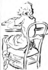
Saggio di un allievo

Molte persone che posseggono disposizioni per il DISEGNO non sono in grado, spesso volte, di trar profitto da queste loro doti preziose. Tra le