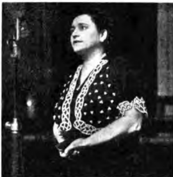
Rosetta Pampanini in una trasmissione per le Forze Armate