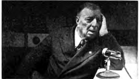
Ermete Zacconi in una trasmissione per le Forze Armate.