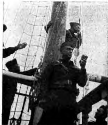
Un vigila al microfono.

L'ultima trasmissione della serie, effettuata il 19 marzo dal Collegio femminile della città di Tirrenia, è stata, come le precedenti, piena di fresca ispirazione e di commosso entusiasmo. Queste graditissime trasmissioni che consentono ai giovani figli degli Italiani all'estero, sorpresi in Patria dallo scoppio delle ostilità, di comunicare spiritualmente con i parenti lontani ed ansiosi di notizie, saranno riprese prossimamente, dopo un breve periodo di sosta, per dar modo ai ragazzi ricoverati in collegi che non hanno ancora partecipato alla bella, affettuosa iniziativa, di inviare alle famiglie parole di saluto e di augurio e di farsi ascoltare nelle loro manifestazioni.