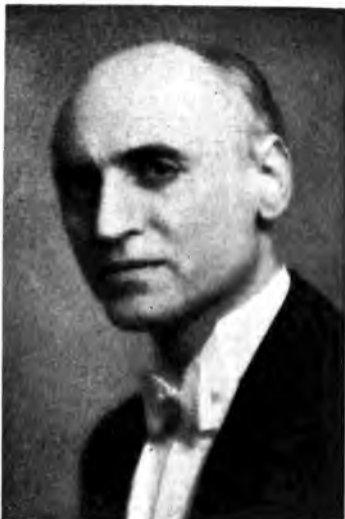
Victor de Sabata

La festosa accoglienza popolare a Gesù che entra in Gerusalemme, scolta nel « Osanna del coro virile » del coro dei bambini e nel grazioso inno: Gloria, laus et honor . La tragedia del processo di Gesù è compendiate in brevi frasi tolte dal Passio , la sua morte descritta dal mirabile responso Tenebrae factae sunt . Esclamazioni enfatiche del precorale pasquale — L'Éziflet — cantato dai Diaconi nel Sabato Santo, introducono finalmente lo stesso Redentore che con melodia sobria, di trascendente spiritualità, afferma la sua resurrezione. L'Alleluia , il canto pasquale per eccellenza, accennato più volte