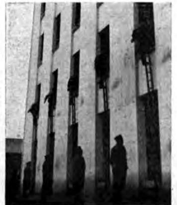
Con la scala a ramponi al castello di manovra.