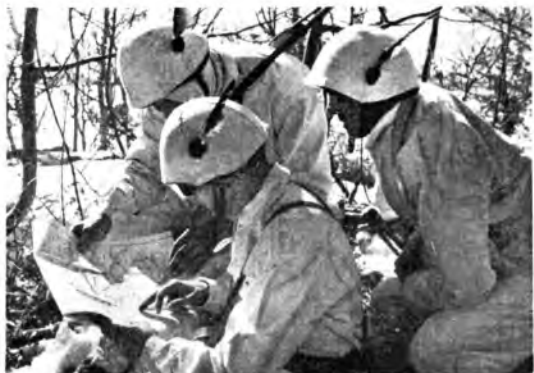
Contro l'estremo rigore dell'inverno russo lotta vittoriosamente la nostra organizzazione logistica. Trasportati su slitte i rifornimenti giungono regolarmente ai reparti sulla linea del fuoco dove i nostri valorosi alpini, in camicia bianco mimetica, fanno buona guardia, sempre pronti a respingere e a contrattaccare il nemico.