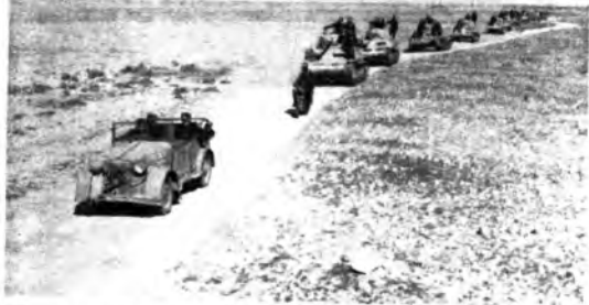
In Cirenaica i mezzi di combattimento antichi e nuovi si alternano in una dura guerra dove agguati e sorprese sono sempre possibili. Mentre le colonne dei carri armati avanzano nel Gebel Cirenaico, nelle zone desertiche dell'Africa Settentrionale reparti di meharisti libici cooperano valorosamente con le nostre magnifiche truppe metropolitane.