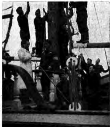
Un'intervista a bordo della nave-scuola