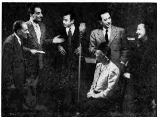
Una scena movimentata della rivista «Primo premio all'amore» di Dino Di Luca.