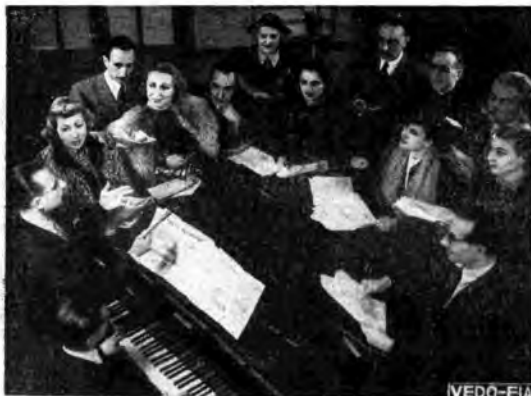
La rivista «Fantasie segrete» di Marchesi in prova.