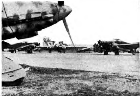
(Fot. R. O. Luce).

Agganciati i siluri, le eroiche squadriglie di affondatori volanti aspettano il comando per slanciarsi sul mare costantemente vigilato dalla nostra flotta e per avventarsi contro le formazioni navali del nemico.