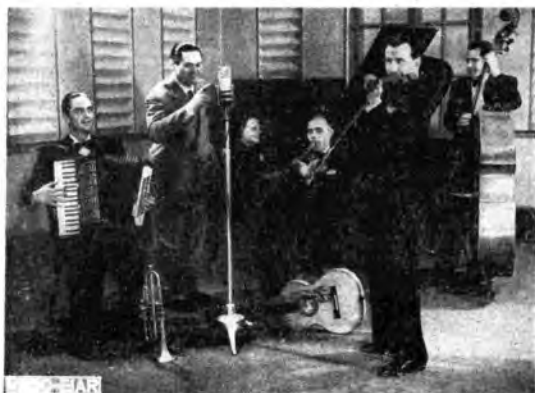
Il Sestetto Jandolo.