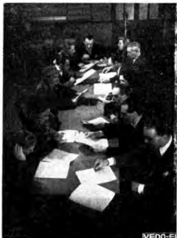
La rivista «Fantasie segrete» di Marchesi in lettura.