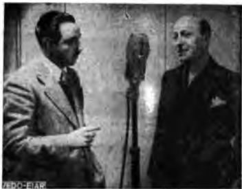
Ruggero Ruggeri, l'illustre attore che ha recentemente dette alcune liriche di grandi poeti nostri con mirabile interpretazione è « presentato » agli ascoltatori dal radio-cronista di Radio Sociale.