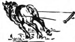
Saggio di un allievo

Molte persone che posseggono disposizioni per il DISEGNO non sono in grado, per via del tempo, di trar profitto da questo loro dono prezioso. Tra le molte cause che vietano di seguire lo studio del disegno e di godere dei sicuri vantaggi che tale studio procura