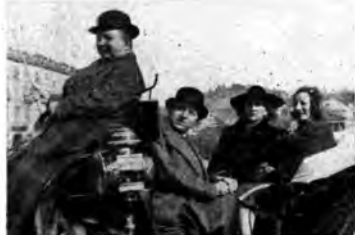
«Un saluto da Torino...» - Ecco tre momenti fotografici di

Tante sono a questo mondo le cose che si possono perdere dal treno al portafoglio, dalla speranza alla realtà, ma certo, tra tutte, una delle più perdute frequentemente è l'ombrello. Socco di questa conferenza sceneggiata è musicata è appunto quello di aiutare tutti a evitare questo grave inconveniente, ma purtroppo neppure il metodo di questa rievocazione all'atto pratico del tutto sicuro.