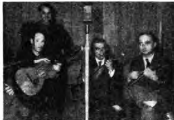
Il Quartetto a plectro del Dopolavoro dell'Ataq.

Le insidie delle malattie contro la vite possono essere così gravi che non si farà mai abbastanza per apprestare le difese; le quali si presentano nel momento attuale particolarmente laborose per la scarsità del rame disponibile. Bisogna quindi adoperare i prodotti ramati con una parsimonia che non ne diminuisca l'efficacia, ed usare questi accorgimenti: con la poltiglia Ramital non si deve aggiungere nulla: né soda né calce, perché l'aggiunta di qualsiasi ingrediente ne compromette l'efficacia. Bisogna pure usare il Ramital in misura giusta: né troppo né poco; mezzo chilo in 100 litri d'acqua nei primi trattamenti; un chilo per i successivi, ma non superare mai i 1400 gr per gli ulteriori trattamenti; in casi gravi, del resto, è preferibile ripetere le irrorazioni piuttosto che aumentare la dose. Invece il Ramato P 1 si adopera sciogliendolo un chilo in 80 litri d'acqua, aggiungendovi poi latte di calce e facendo frequenti passaggi con le cinghie alla fenofaleina fino a che queste diventino di color rosso carico. Se occorre far fronte ad attacchi gravi di peronospora, si può usare il P 1 fino a 1/1-2 chili. Ma giova sempre far seguire ai trattamenti liquidi quelli pulverulenti con zolfo ramato, mirando a colpire i grappoli, prima o durante la fioritura, oppure, appena avvenuta la formazione dei grappolini, mescolando per far massa allo zolfo ramato, calce sifonata o