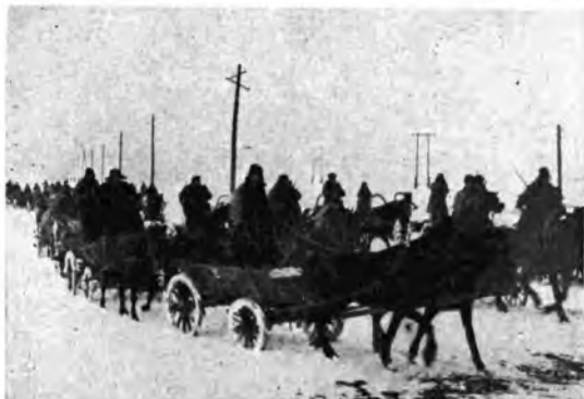
Al fronte russo, con meraviglioso spirito di adattamento, i soldati italiani, sfidando e superando i rigori di un inverno eccezionale, hanno continuato a combattere e a vincere, senza lasciarsi arrestare dalle impervie difficoltà del terreno ingombro di neve e di ghiacci.