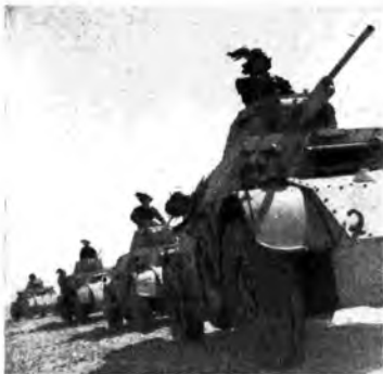
Autoblinda di una colonna celere nel deserto Erenaco.