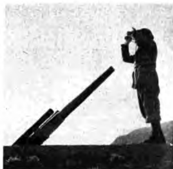
Una batteria della difesa contragea territoriale pronta per entrare in azione. (Fot. R. G. Luce - Pavanelli).

L'«Ariete», un nome eroico che fa palpitare di ferezza tutti gli italiani: «Ghost Division», Divisione fantasma, l'ha chiamata il nemico con un'espressione quasi puerile di pauroso rispetto perché, sebbene sempre in prima linea, l'«Ariete» ha saputo sistemarsi sapientemente nelle pieghe del terreno e confondersi con esso mediante gli accorgimenti tecnici di un perfetto mimetismo di guerra. Con il documentario dell'«Ariete», che verrà trasmesso martedì 19 maggio, si chiude la serie delle numerose trasmissioni registrate da Franco Cremasoli in Africa Settentrionale. Anche questa volta, persistendo nel concetto informativo che il radiocronista deve essere sempre pronto a mettersi da parte, a collocarsi per così dire lateralmente all'avvenimento o all'azione da registrare, i protagonisti del documentario sono di volta in volta i carristi, gli artiglieri o i bersaglieri. Soffia il ghibli; oggi non si combatte... Ed allora fa bene al cuore ed allo spirito rievocare i gloriosi e vittoriosi combattimenti di Bir Cremis, Sidi Rezeg, Quota 20... E ancora: la irresistibile riconquista della Cirenaica, la presa del Forte di Sceididma... Le rievocazioni dei combattimenti sono