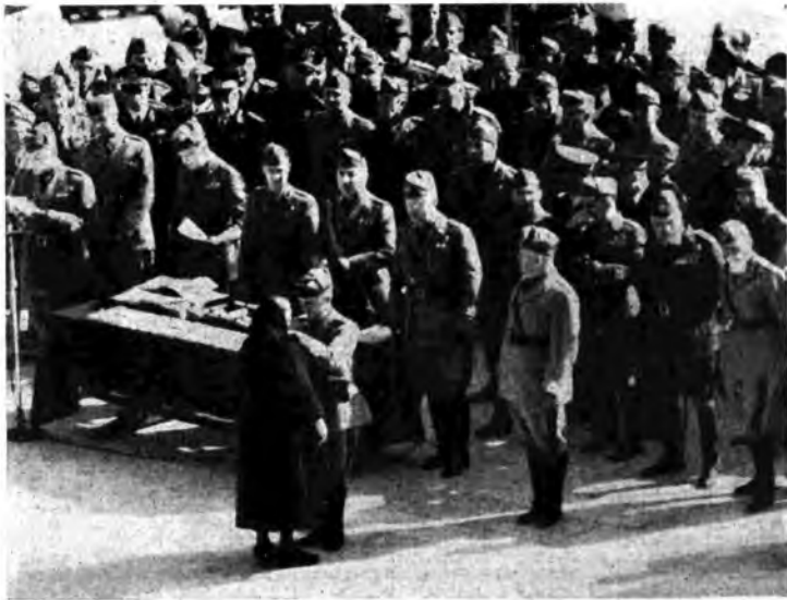
La solenne celebrazione del 9 Maggio, Giornata dell'Esercito e dell'Impero, si è svolta in tutta Italia con austeri riti confermati: l'incrollabile volontà di vittoria che anima l'intera Nazione. Mentre a Roma il Re Imperatore, presente il Duce, consegnava la massima ricompensa ai Valor Militari a quattro eroici Viventi ed ai familiari di cinquanta eroici Caduti, un'intrepida ala tricolore, spiccato il volo dalla Madrepatria, giungeva nei cieli etiopici come promessa e preannuncio del nostro immane ritorno in quelle terre africane consacrate dal lavoro e dal sangue Italiano.

Ci si domanderà: volete voi alzare una muraglia cinese intorno alla cultura italiana? Abolire, nella sfera spirituale, il commercio con l'estero? Niente affatto, rispondiamo. Anzitutto, stiano tranquilli gli studiosi; non si minaccia in alcun modo, anzi si agevola il necessario intercambio delle conoscenze. Quanto alla divulgazione, quanto alla cultura popolare, si parte dal seguente principio, che ci sembra irrefutabile. L'Italia è — dal punto di vista della produzione culturale e artistica — uno fra quei grandi Paesi che tutto designa, per una naturale autarchia, nonché per funzioni di esportazione, di irradiamento. Tutto: la storia, la tradizione, l'indole, la fre-