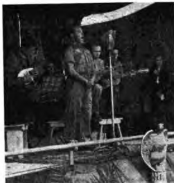
Uno spettacolo per i soldati organizzato dall'«Eiar» in una località dell'Africa Settentrionale. Assistenti e partecipi allo spettacolo anche dei militari del Corpo di spedizione tedesco.

tro questo mezzo nemico di offesa se eventualmente fosse tentato. Consigli, istruzioni, suggerimenti utili agli agricoltori, sono dati ogni domenica nell'«Ora dell'agricoltore» alle 10.