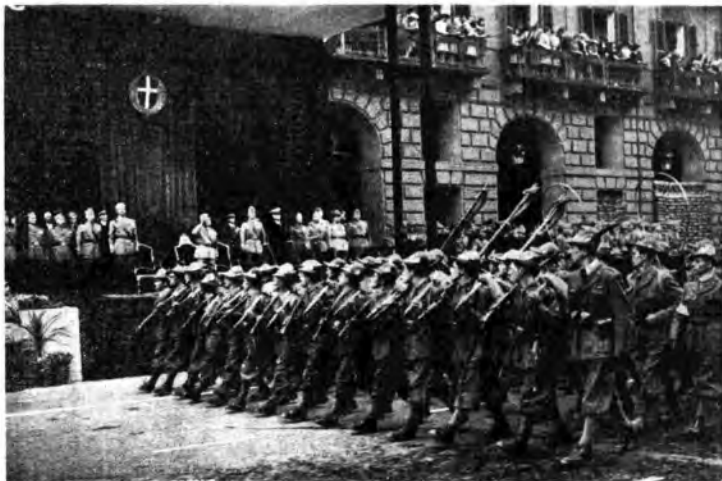
A Torino: l'imponente sfilata delle truppe dinanzi al Sovrano.

In questo clima prozioso e pieno di lieti presagi si è solennemente celebrato il terzo annuale del Patto d'acciaio, che ha saldato insieme, in un solo blocco di volontà, le due grandi rivoluzioni europee, rivoluzioni costruttive, revisioniste, sorte per riparare ad ingiustizie geografiche, sociali ed economiche non più oltre tollerabili da parte dei popoli