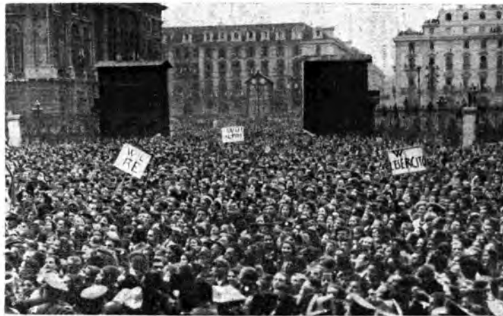
A Torino: le entusiastiche acclamazioni della folla al Re Imperatore.

Un motto che dal mare si estende al cielo ed alla terra perché su tutti i fronti e con le più diverse e svariate armi, dall'aeroplano al carro corazzato, dalla mitragliatrice alla bomba a mano e, se occorre, alla baionetta, i soldati d'Italia hanno sempre saputo fare prodigi e sapranno rinnovarli in questa fervida ripresa di azioni guerriere. E questo il fermissimo impegno che il Re Imperatore ha letto nel fiero sguardo delle truppe recentemente passate in rivista dal Sovrano a San Remo, a Cuneo, ad Alessandria, a Torino e a Novara. Fedele alla grande tradizione sabauda di mantenere personalmente i contatti con i Suoi Soldati, il Re, vittorioso di tre guerre e che coronerà con un quarto e definitivo trionfo l'epica storia del suo glorioso regno, è passato, acclamatissimo, tra le agguerrite schiere di ogni Arma e l'imponente dimostrazione di forza compatta e pronta si è integrata con quella popolare non meno grandiosa, non meno vibrante di entusiasmo. Ancora una volta il Re Imperatore ha sentito di quanta affettuosa e devota fedeltà lo circondi il Suo Popolo, che rielabora e riempie dal Fascismo alle più alte aspirazioni nazionali, ravviva e scorge nell'augusta Persona del Sovrano il massimo esponente, il massimo rappresentante di quelle storiche ed insuperabili idealità che formano il sacro retaggio degli avi e la certa promessa di un luminoso avvenire.