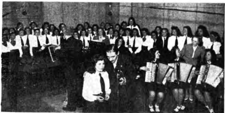
Il Collegio Femmine della «Gile» di Castiglion Fiorentino in un auditorio della Stazione di Firenze.

Sempre ascoltativissime riescono le trasmissioni per le donne italiane, organizzate dall'Eiar in collaborazione con i Fasci Femminili. Nell'ultima trasmissione, che ha suscitato un vivissimo interesse, venne ricordato uno dei più singolari fra i tanti episodi commoventi relativi alla raccolta della lana, e sono state date dettagliate notizie sulla vita, sull'attività e sul proposito delle donne norvegesi. Ha completata la trasmissione un «notiziario panoramico» e alcuni consigli pratici sull'andamento della casa. Nella prossima verranno trattati argomenti di vita attuale.