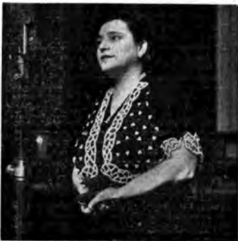
Rosetta Pampanini, interprete della « Wally » di Alfredo Catalani.