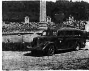
Grande autocarro attrezzato dell'Eiar (Stazione trasmittente e apparato di registrazione) che ha funzionato al Campo delle Cascine

Esposto poi il programma dei lavori, ha dato la