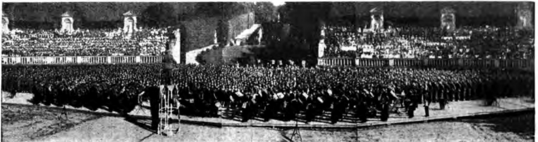
Il Concerto corale e strumentale organizzato dalla Gil nel giardino di Boboli.

tecnico e professionale; di creare dei centri sperimentali di radiofonia presso i Comandi Federali per far sperimentare ai giovani le varie forme di radioprogramma giovanile e la loro possibilità di realizzazione. I giovani desiderano di dare in loro