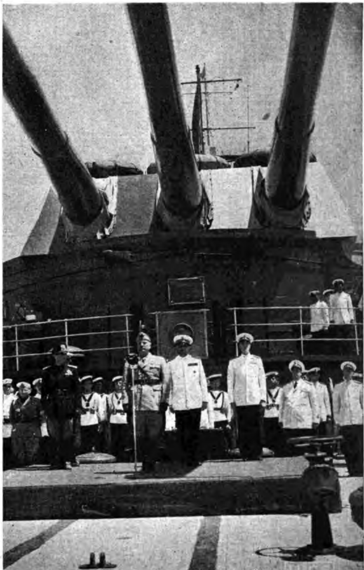
Il Duca, a bordo di una delle nostre grandi unità che ha partecipato alla battaglia del Mediterraneo orientale, parla all'equipaggio schierato.