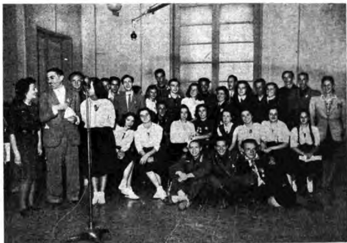
Giovani italiani e stranieri nell'auditorio di Radio Firenze dove hanno partecipato ad una speciale trasmissione ad essi dedicata.

Ma la commedia, nel suo valore, comincia al terzo atto. Allorché, reduci da un lungo viaggio di svago, uno di quei viaggi che non servono mai altro scopo per il quale sono intrapresi, Maria e Corrado rientrano nel loro domicilio coi segni di un'inutile lotta nascondamente combattuta. Maria è in uno stato di decadimento fisico, Corrado