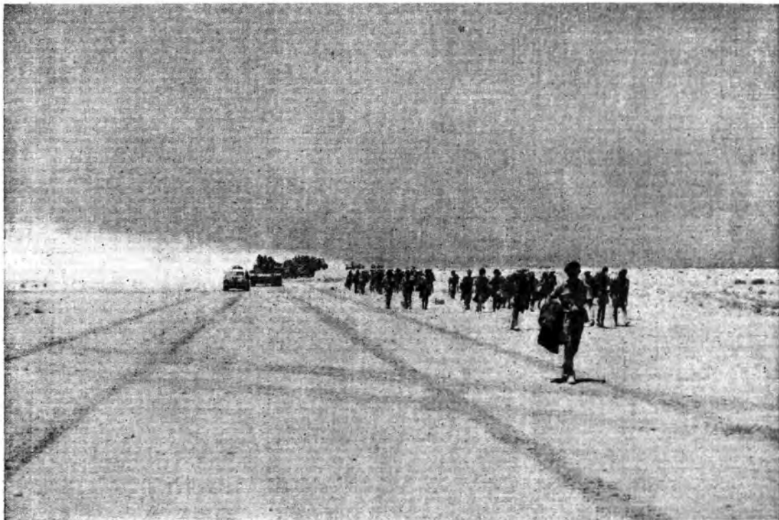
Le truppe dell'Asse in territorio egiziano - Prigionieri inglesi avviati verso le retrovie.

Dovunque dall'Egitto al Don e alla Cina, sotto le insegne del Tripartito i popoli combattono per la loro emancipazione da un'egemonia antistorica e antimorale. Nelle pianure russe e nelle valli cinesi come nel deserto africano masse di uomini muovono all'assalto in nome di ideali negati e offesi: da quelle plutocrate che in limbo utopico non hanno esitato a legarsi col bolscevismo negatore e sovvertitore d'ogni sacra legge e d'ogni sentimento umano; ma codesti ideali trionferanno, nella vela degli eserciti dell'Asse, espresione della giovinezza mistica e ardente che nutre la propria certezza di vittoria alla fiamma d'una purissima fede.