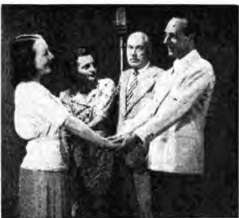
Una scena de « Il mito di Armando » di Gino Valori