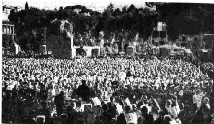
Nella Basilica di Massenzio: l'Orchestra di Santa Cecilia diretta dal M re Bernardino Molinari e la folla degli invitati.