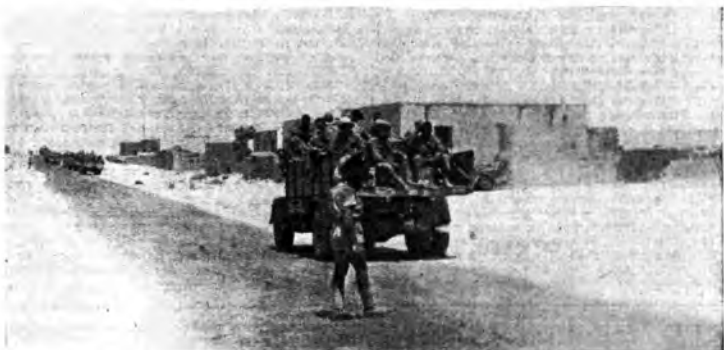
Africa Settentrionale - Affluiscono i rinforzi verso la linea di combattimento.