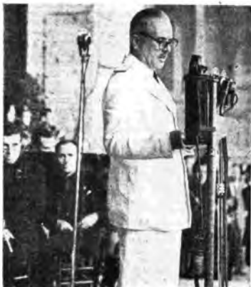
Il messaggio del Governatore.