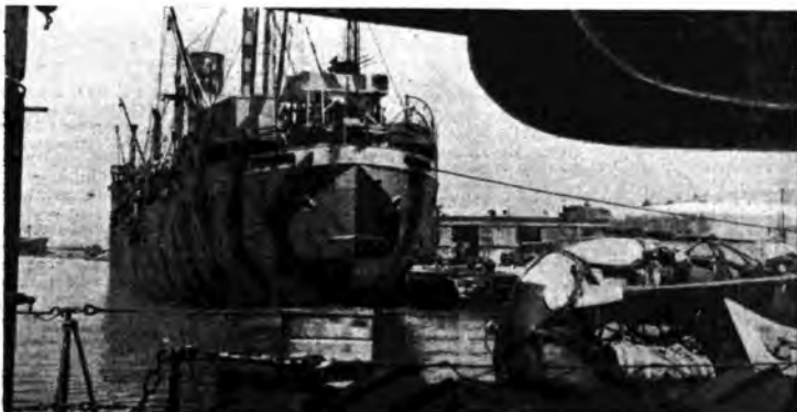
Arrivo di un nostro convoglio in un porto dell'Africa Settentrionale.