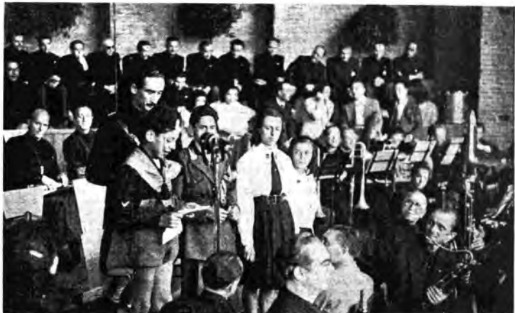
Le famiglie salutano i combattenti: Al Balilla, seguono una Piccola Italiana, un Avanguardista, una Giovane Italiana, una Figlia della Lupa e una Madre trasteverina.