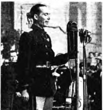
Il saluto del Federale.