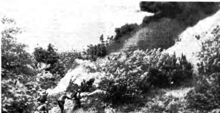
Fronte russo - Reparti di guastatori italiani attaccano con i lanciafiamme.

Eso vede l'Italia in linea dovunque, dal suo egiziano al basso Don, con tutta la sua efficienza bellica e con tutto il suo cuore. Il contributo che la nostra Armata dà alle operazioni sul fronte orientale — dove l'offensiva germanica già batte irresistibile alle porte del Caucaso e minaccia i centri vitali del pertinace nemico sgretolandone la resistenza — è di primissimo ordine e quotidianamente ci pervengono notizie di progressi che alimentano le più esaltanti speranze. Ora si marcia oltre il Don, i fanti, i bersaglieri e le specialità che combattono al di là del gran fiume russo sono degni di coloro che vincendo la battaglia di El Alamein hanno costretto il nemico a porsi il più angoscioso degli interrogativi sull'efficienza prossima delle sue posizioni nella valle del Nilo e nel Medio Oriente.