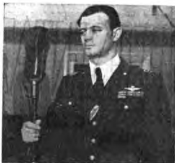
Il Comandante Buscaglia.

Il comandante Buscaglia, l'asso degli aerosiluranti, ha parlato la scorsa settimana agli ascoltatori di Radio Sociale e ha parlato proprio nel giorno in cui i Bollettini del Quartier Generale delle Forze Armate davano notizie della ennesima disfatta inglese nel Mediterraneo. Con la semplicità e la franchezza che è nel suo carattere e nel suo temperamento, l'eroico aviatore novarese, che ha affondato due incrociatori pesanti, due incrociatori ausiliari, un posaretti e cinque piroscafi e che ha colpito e gravemente danneggiato due navi da battaglia, una portaerei, sei incrociatori, due cacciatorpediniere e tre piroscafi, ha raccontato qualcuna delle sue imprese glorificando la sua arma. Ai camerati lavoratori ha chiesto di lavorare con lo stesso impegno, lo stesso fervore, lo