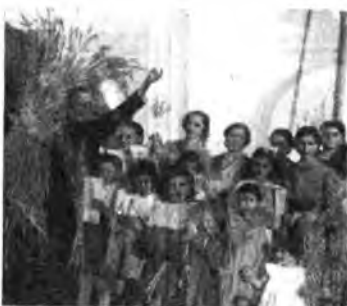
Il parroco e le spigolatrici di Presenzano.

Dare quest'anno la massima diffusione ed incremento ai sistemi casalinghi di conservazione della frutta costituisce senza dubbio un tangibile e prezioso contributo all'approvvigionamento alimentare della Nazione in guerra, oltreché un non indifferente apporto economico al bilancio familiare dei coltivatori. Ma questa conservazione deve essere orientata verso quei sistemi che fanno astrazione dall'uso del zucchero e di altre sostanze di cui si ha ora una sensibile scarsità e