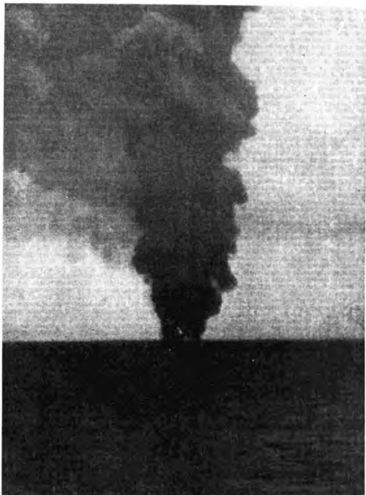
Petroliere nemiche colpite da nostri aerei nel Mediterraneo Centrale.

Ed ecco che la battaglia, pur così importante per i suoi risultati immediati e mediati di ordine strategico e logistico, si trasferisce su di un piano ancora più alto, il piano psico-