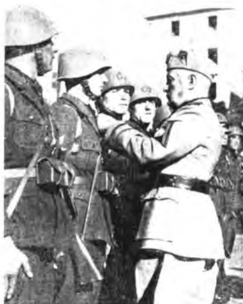
Roma - La celebrazione della Leva Fascista: il Duce e alcuni legionari dei Battaglioni « M. »

Frattanto la gigantesca città capitale del Volga che porta il nome del despota rosso, agonizza sotto la furia dei bombardamenti: si sfascia materialmente, quartiere per quartiere, demolita dalle