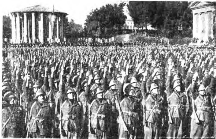
Roma - La celebrazione della Leva Fascista: il saluto al « Duce dei Battaglioni « M. » »

« epoca vedrà il Littorio trionfante », ha affermato il Duce. Devesi dare alla formula mussoliniana « Littorio trionfante » un'estensione ed una applicazione assoluta che interessano i tre Continenti dove si combatte perché è merito iniziale dell'idea di revisione e di giustizia che il Littorio rappresenta, se il mondo uscirà rinnovato da questa prova tremenda e decisiva. Una è la guerra dei popoli totalitari, una sarà la vittoria.