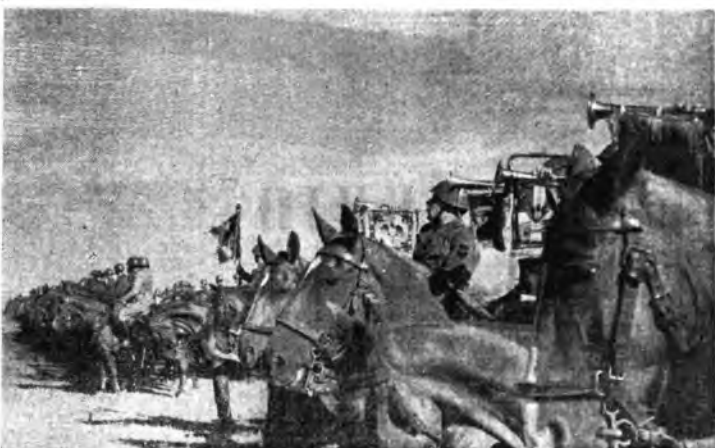
Schieramento di nostri reparti di cavalleria operanti sul Don.

granate e divorata dalle fiamme. Stalingrado e « Maragonia », non più una battaglia che abbia un senso o scopo, una speranza. Non meno favorevole scelse per l'Asse la battaglia del Caucaso dove i pozzi e le raffinerie di petrolio costituiscono la ghiotta preda dei vincitori. La perdita della casacca, se si volesse fare un facile gioco di parole, sarà essenziale per l'Asse ed esaltante per la Russia hitascistica. Privato di gran parte della sua attrezzatura industriale, delle sue zone agricole, dei suoi castorani, il colosso, ridotto di territorio, di popolazione, vede approssimarsi il generale Inverno con una nuova prova inquietudine.