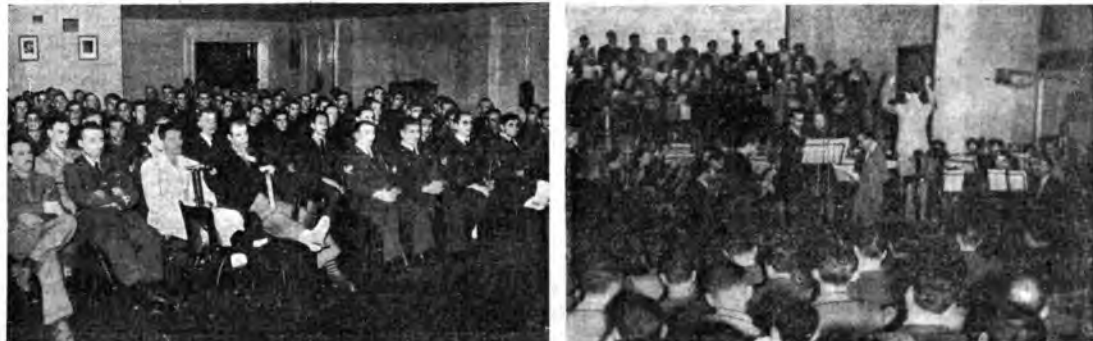
Una trasmissione di Radio Igea alla quale assistono combattenti e feriti.