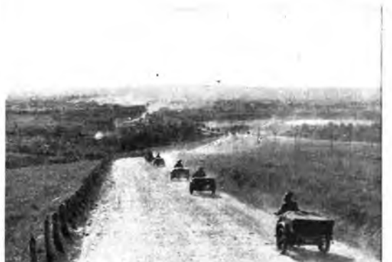
In Russia: Colonne celeri di bersaglieri dell'Armia lungo le strade delle zone occupate sul fronte russo.