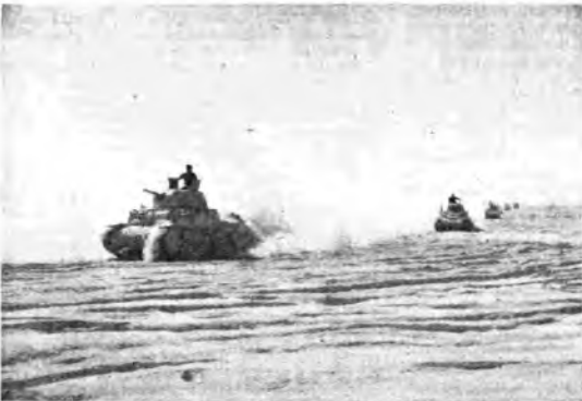
In Egitto: Attraverso le sabbie del territorio egiziano i nostri carri armati procedono verso le prime linee.

Contemporaneamente agli impianti trasmettenti, l'EIAR provvedeva alla costituzione dei Centri produttori di programmi, dei quali i principali vennero stabiliti a Roma, Torino e Milano, provveden-