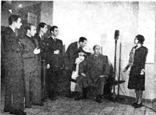
« Santa Cecilia », mistero in un atto di Carlo Trabucco.