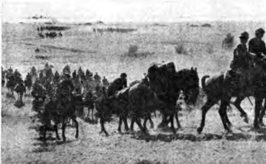
Fronte orientale: Squadroni di cavalleria dell'Armii attraversano le zone steppe.

delle calamità naturali, dei cataclismi. Tanta dolorosa esperienza si è iscritta nel subconsciente della razza e di questa ha fortificato la virtù di sopportazione. Ma tutto questo il nemico non sa nella sua presunzione altezzosa. Di noi, del nostro carattere, del nostro modo di agire e di reagire si è fatto, per suo uso e consumo, una facile e comoda convinzione. Sperava di atterrirci e la brutalità dei suoi metodi (bombardamenti di città aperte, siluramenti di navi-ospedale, mitragliamenti di ospedaletti da campo o di popolazioni inermi) ha invece servito ad aprire gli occhi anche a quegli incorreggibili ingenui, non ancora del tutto guariti da certi erratissimi pregiudizi esterofili, che ritenevano essere l'inglese popolo di alta civiltà ed indiscutibile unità.