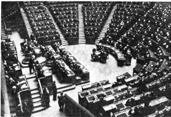
ROMA - Il grande discorso del Duce alla Camera dei Fasci e delle Corporazioni

Con le Sue alte e precise parole il Duce ha quindi fissato il carattere essenzialmente nazionale della lotta che non ha né può avere o ammettere compromessi, ma deve giungere ad una delle due conclusioni prospettate nel memorando discorso: essere o non essere. Ebbene, saremo. Offesa e ferita nella sua sensibilità umana, nel culto religioso delle sue memorie, nella sua stessa bellezza, che è frutto di natura e di arte, l'anima nazionale che il nemico sperava di piegare e di disgregare con i bombardamenti terroristici e demolitori, dimostra la sua vitalità, la sua immortalità nella riso-