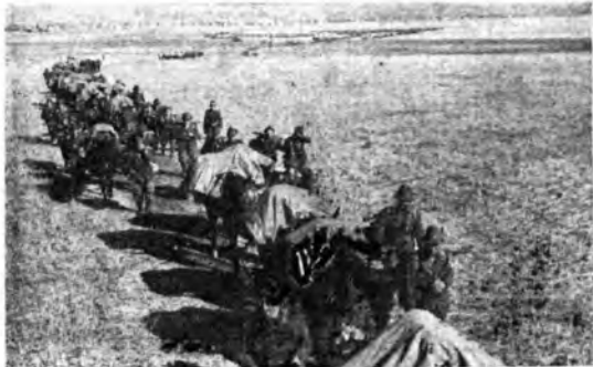
Fronte orientale: Truppe alpine soggettate dell'Armii in marcia verso nuove posizioni.