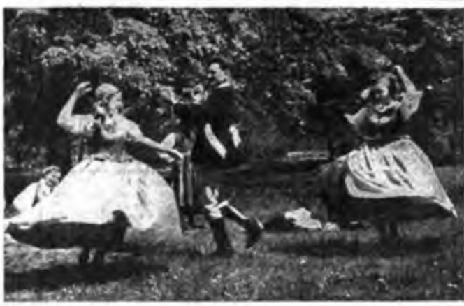
Venerdì ore 21.15 - Gruppo Nord - Programma A B.