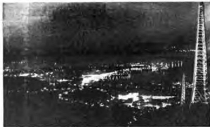
Le antenne di Radio Trieste dominano la città, l'abbracciano e ne esprimono la voce. Con loro è il nostro cuore, mentre si decidono i destini del porto, delle case e della gente di Trieste; oggi il nostro cuore è lassù, irradiando con i fili dell'antenna, e attende un verdetto che sia giusto per Trieste e per l'Italia nel concetto di una Europa pacificata tesa a un rinnovamento morale e materiale dei suoi popoli.