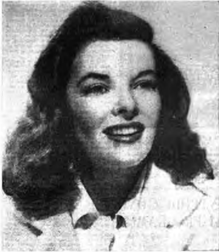
KATHARINE HEPBURN, IN "INCANTESIMO"