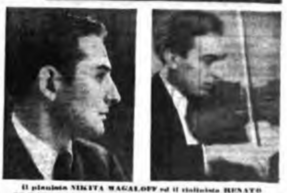
Il pianista NIKITA MAGALOFF ed il violinista RENATO DE BARDINI partecipano al Concerto di musica polacca