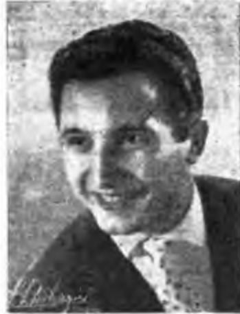
VINO DE ASTIS canta a Radio Torino