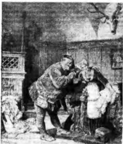
— FALSTAFF —

Pertanto il carattere umano dell'ultima opera,