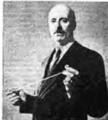
Sir ADRIAN BOULT che ha diretto l'Orchestra sinfonica e l'Accademia Corale della BBC nel « Requiem di Verdi » trasmesso il 12 giugno scorso

(sinfonica). b) Notiziario e comunicati; c) Conversazione di R. Huldshimor e Dio Brücke. 20,20-20,30 Comunicati; 23,10 Messaggi.