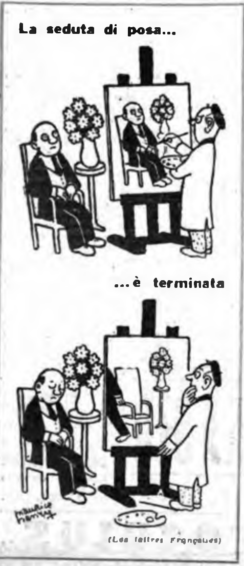
La seduta di posa...