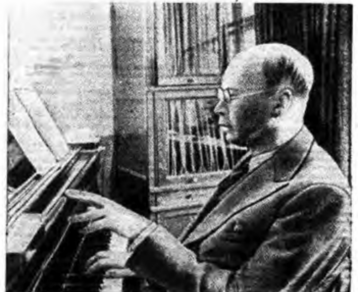
Il compositore russo PETER TCHAIKOVSKY del quale sono state regolate alla Radio diverse composizioni