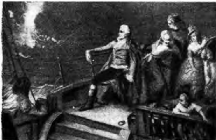
Una drammatica traversata portò Haydn in Inghilterra