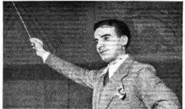
FERNANDO PREVITALI dirige il « Fabbrica » nella Stagione Lirica della RA. I.

24-0.45 (Milano I - Busto Arsizio I) NOTIZIE DI EX-INTERNATI E PRIGIONIERI DI GUERRA: per i familiari residenti in Sicilia, Sardegna, isole minori e territori extra nazionali