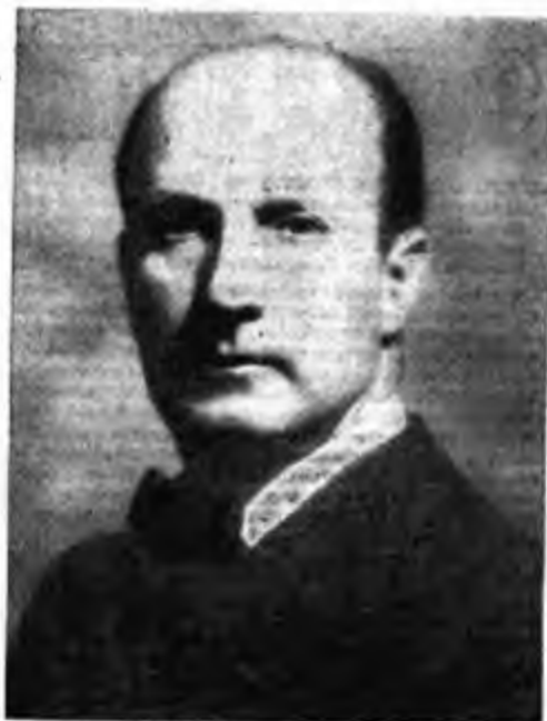
Il Maestro VITTORIO GUI

concessione al belcanto ancora predominante nell'epoca); segue poi il coro, che invita a celebrare la nuova opera del Signore; coro che a un certo punto si sviluppa in un ampio fugato. Particolari bellissimi della quarta giornata sono l'arcenna (movimento ampio e saccente su un crescendo al sorgere del sole, maestoso e splendente, e le delicatissime e morbide sonorità, mirabili per varietà di accenti e intimità espressiva che indicano l'apparizione della luna. La prima parte si chiude con un possente coro, divenuto ben presto patrimonio di tutte le società corali: « I cieli narrano la gloria del Signore ».