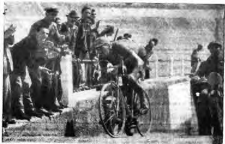
Ore 16.45 e 19.55 servizio speciale RAI per il Giro d'Italia

0.30 «Les Savoyards» a pianoforte. 2.15 «Musica» 3.15 La musica. 3.30 La musica di un'ora: programma composita fra la B.B.C. e la Columbia Records. 4.45 Questa sera in città. 6.10 «Sovietismo» del disco. 6.30 Spettacolo di varietà. 7.15 Concerto di tenore Donald Britton. 8.15 Musica del mattino in diretta. 8.45 Notiziario. 9.45 «Musica» di teatro. 10.15 Concerto orchestrale diretto da Charles William. 11 Billy Turner e la sua orchestra. 11.30 Organ da teatro. 12 La musica da camera. 12.30 Musica da camera. 13.15 Nuovo complesso di musica di Londra diretto da Norman Miller. 14 Francis Britton: «Serenata»; 2. Vaughan-Williams: «Fantasia su un tema di Tallis». 14 «Radiogrammi di società». 15.05 «Musica» di piano. 16 «Tri Menti» e la sua musica. 16.30 «Antonia» di «Pop» di «Antonia». 18.15 «Musica» di piano orchestrale. 19.15 «Musica» di piano. 19.45 «Musica» di piano. 20.15 «Musica» di piano. 21 «Musica» di piano. 21.15 «Musica» di piano. 23.45 Musica da camera.