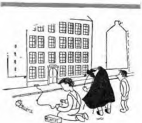
« Voglio un po' vedere, se non sbagliamo il concorso per la fotografia più sensazionale! »