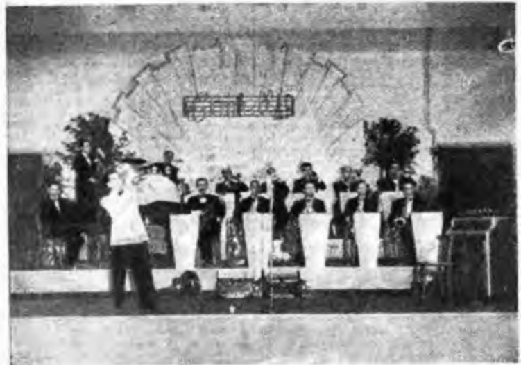
L'Orchestra GEWANDHAUS trasmette attualmente da Radio Milano