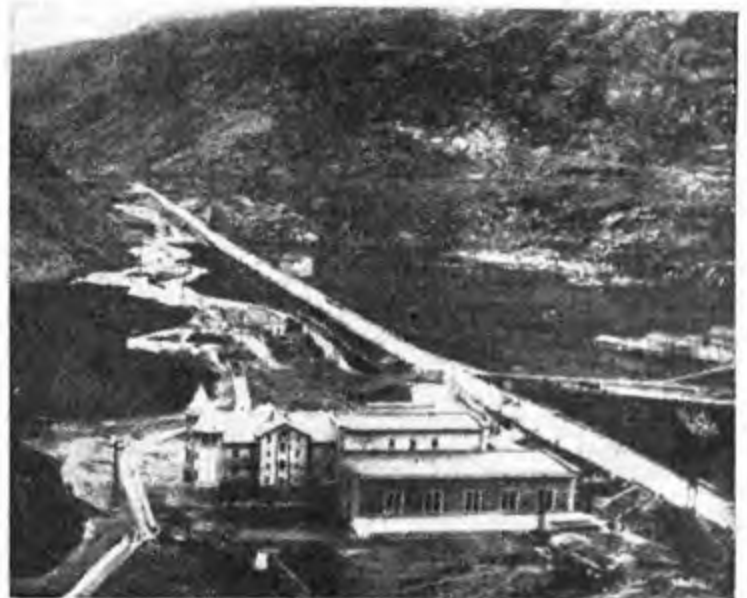
La centrale Gran Scala — la prima centrale del complesso del Moncenisio — importante soprattutto per la sua funzione di riserva degli eccessi di energia

...colto con quella di Parigi... La soluzione del problema... ...di notte... ...di questi nostri diritti... ...la Repubblica si dichiara... ...che rubargli... ...alla loro Patria... ...concedere... ...possibilità