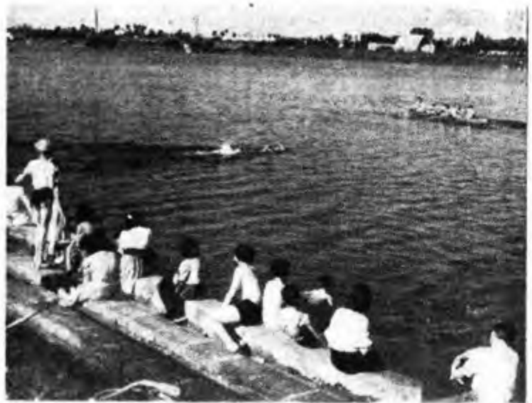
Manca soltanto il gusto salso dell'acqua: con un po' di fantasia ogni città ha il suo retigliero e il suo circolo mare.