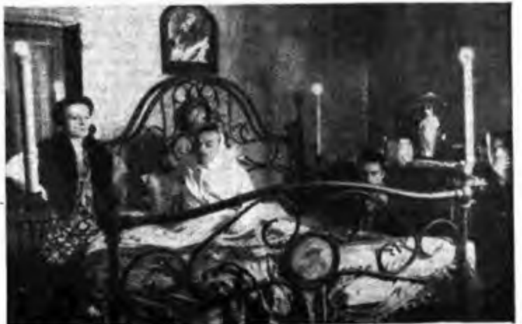
Una scena di «Napoli millenaria» - Un recente scorcio di Eduardo De Filippo.

Pochi mesi fa è stata trasmessa questa commedia e per le più ampie notizie rimandiamo al n. 7 (17-23 febbraio '46). Basterà ricordare come la trama del lavoro sfiori da vicino la vita del Poeta e come le disavventure di Arnolfo, causate dalla giovane moglie, altro non siano che la interpretazione artistica dei casi coniugali del non giovanissimo autore e della moglie quasi adolescenziale.