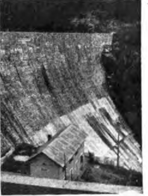
UN'ALTRA VEDUTA DELLA BICA DI SAN DALVAZZO