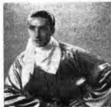
TILDE RUI Cantante argentina dell'Orchestra Ortano