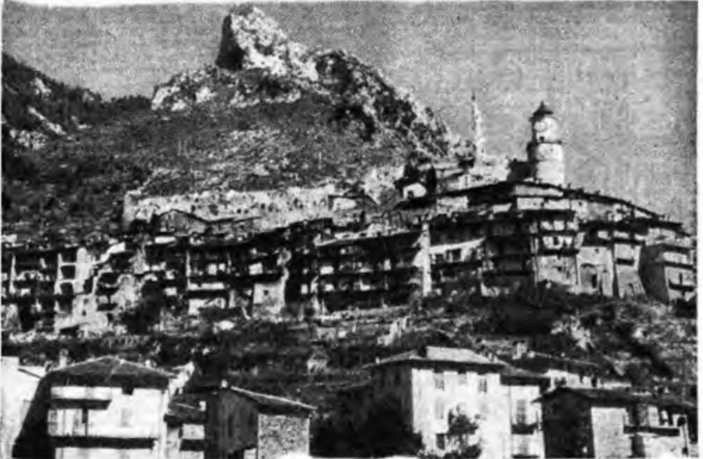
LA CITTADINA DI TENDA

Donna lombarda è appunto la prima delle Tre Canzoni , ed è la storia tragica e cupa, drammatizzata in ingenui dialoghi, della donna innamorata del Re di Francia (Sagra Cornina), il quale le consiglia di avvelenare il marito, schiacciando la testa di un certo serpente che si trova nel giardino di suo padre e versandola nella bevanda dello sposo. Energica e rude suona all'inizio il comando del sovrano: « Aniam! tu, donna lombarda! » e dolce ed accorata