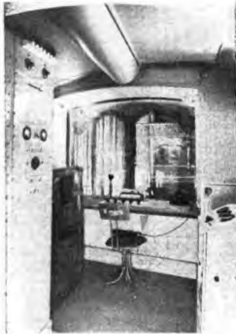
Una cabina di dosaggio predisposta in un palco di teatro. È isolata dalla sala mediante un doppio cristallo.

Quasi al contempo, non più a centinaia, si hanno a migliaia, le lettere pervenute alla Radioda parte di ascoltatori d'Italia e dell'estero i quali, pieni d'entusiasmo per le trasmissioni trasmissioni, hanno mandato espressioni di compiacimento e di lode.