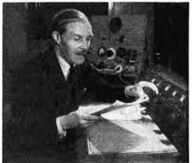
Come si dosa una trasmissione. - Al comando è un tecnico modulatore della B.B.C.