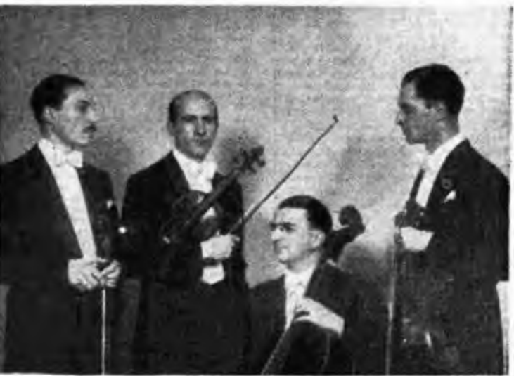
QUARTETTO 1941. Documenta ore 21.15. Gruppo Nord - Crege. A

18 Musica sinfonica - 1. Paganini: Fantasia regale. Trascrizione di Luzzi. 2. Corelli: Il portatore d'acqua, melodia dell'opera; 3. Ciaikovsky: Marcia slava, op. 31; 4. La Rosa: Pavana. Cleopatra, finale del quarto atto. Monte di Cleopatra. 18.30 Musica da film - 1. D'Amico: Marchesi. D'ore sogno, dal film « La scuola del lunedì »; 2. Botta: Canzone del calesse, dal film « Il richiamo di papà »; 3. Arzo: Nera. Ombra del passato, dal film « Gover gallo »; 4. Ignoto: Stevie. A suon di musica, dal film « Partenza ore sette »; 5. D'Amico: Vento. Male d'amore, dal film « Partenza ore sette »; 6. Shostakov: Toccata-scherzo, dal film « La mia vita »; 7. Botta: La maestria se ne va, dal film « Il richiamo di papà »; 8. Di Lazzaro-Bruno: La canzone dell'usignolo, dal film « Il diavolo va in colliggio »; 9. Fandini: Adios muchachos, dal film