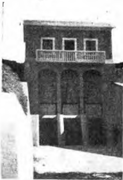
Impianti del Mantegna: la diga di San Nicolao

Le ingiuste mullazioni, che il Presidente del Consiglio De Gasperi, stigmatizzando le decisioni del «Quattro», ha chiamato «ferite insopportabili alla coscienza nazionale» sono delle vere e inique spoliazioni in danno del nostro Paese.