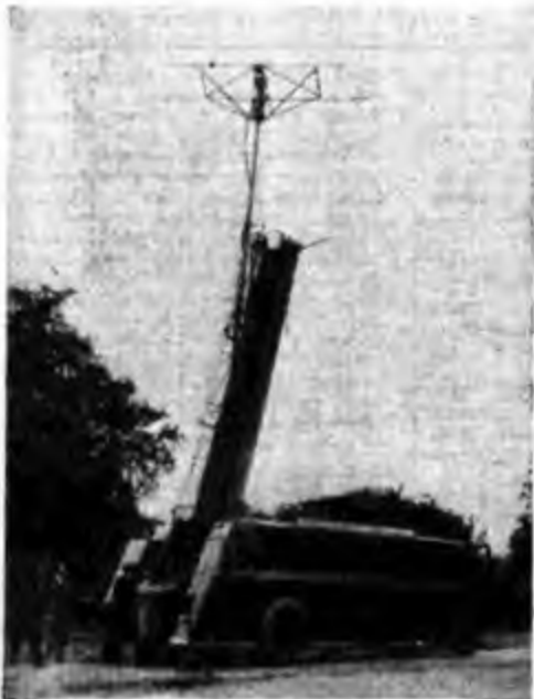
Impianto televisivo autotrasportato della B.B.C.