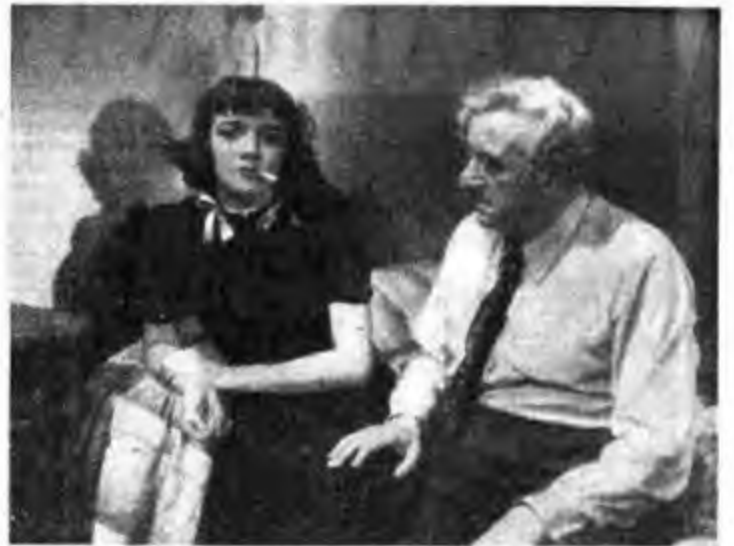
In questo quadro del film «Ultima giovinezza» è tutto Raimu e il suo «tipo»: bonarietà serena dei semplici e accorata comprensione di chi molto perdona

Certo, Raimu non ha ritratto soltanto contadini: egli tuttavia ha costruito quasi sempre i suoi caratteri su una base paesana, aggiungendo e cambiando il tipo, solo in quanto il particolare soggetto era più vicino o lontano all'audiente della terra. Ne Uomo che cerca la verità , per esempio, egli interpretava la figura di un banchiere corrotto in una relazione sessuale mondana. Allora le sue guancie barbute erano rasate, i suoi capelli di solito scarduffati erano nettamente composti, invece della sua solita blusa grinzosa coi bottoni che saltano, egli indossava una giacca da sera di linea corretta, le sue maniere e il suo parlare erano impeccabili. Ebbene, anche con tutto