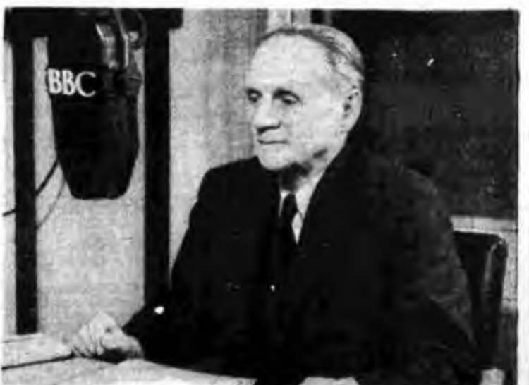
Parla al microfono della B.B.C. Sir Norman Angell, il famoso autore de « La grande illusione » e premio Nobel 1933.