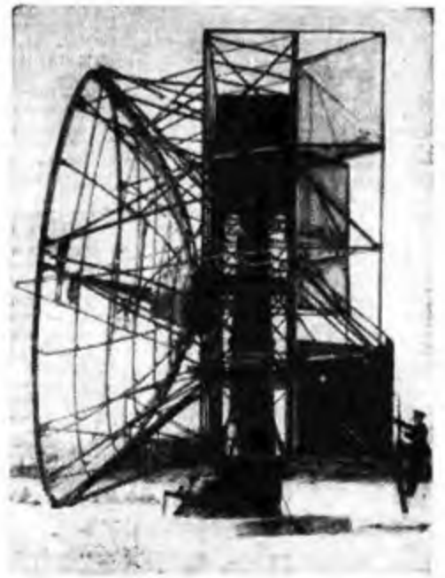
Tipo di riflettore Radar per il controllo ed il puntamento di aerei nemici. Questa attrezzatura ebbe molto successo nell'aiutare l'intercettazione e la direzione delle bombe volanti.

realità sarà invece quanto mai duro per esse giacché l'uomo, ora che sembra aver finito di dar la caccia ai suoi simili, si appresta a decimarle, e questa volta con l'ausilio di mezzi potenti, le vaste schiere di cetacei, certamente moltiplicatesi abbondantemente in questi ultimi anni. Una Compagnia britannica ha infatti organizzato quella che sarà la più grande caccia alle balene della storia, e per questo ha ingaggiato una squadra composta di sei persone, tre piloti e tre operatori radio, già appartenenti all'Aviazione della Marina, i quali proprio in questi giorni hanno ultimato in un aerodromo presso Cowes il loro addestramento per divenire i primi avvistatori aerei di balene dell'Antartico. Verranno usati apparecchi anfibio Walrus (Tricheco) e gli aviatori, che durante la guerra hanno dato la caccia agli U-boat germanici, sono stati addestrati all'impiego di tutto un equipaggiamento — piccole stazioni radio di emergenza, apparecchi trasmittenti adatti a sopportare le più basse temperature, e luci e riscaldatori elettricamente, robuste tende per il caso di forzati atterraggi — che ricorda la passata esperienza bellica. Essi verranno catapultati dal ponte di una nave appoggio di 32 mila tonnellate per esplorare centinaia di miglia quadrate dell'oceano. Non appena avvistata la preda, i radiooperatori ne segnalano la posizione ad una flottiglia di 12 baleniere, tutte munite di cannoncini per il lancio di arpioni recanti anche una carica di esplosivo.