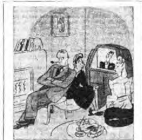
LEI — I fabbricanti di apparecchi assicurano che grazie a Frank Sinistra venderanno più di 100.000 apparecchi.

Presidente del Comitato Cinematografico del Comando Militare Alleato della Venezia Giulia