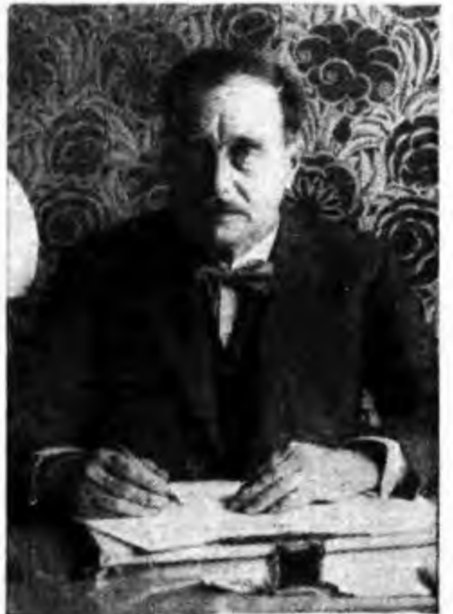
H. G. Wells al tavolo di lavoro con due nascere tante prodigiose e profetiche fantasie.

In tutti i suoi libri, Wells descrive e dipinge la vita di tutti i giorni, con qualche punta di terrore umoristico, ed inserisce le più audaci visioni del suo mondo futuro, le più ardite concezioni sociali, frammentando illuminazioni e utopie, realtà e sogno. In ogni pagina prorompe prepotente la nobilissima anima dell'autore, di questo visionario che fermamente e sinceramente crede nella scienza, nel progresso, in un redento avvenire del genere umano. Wells sogna e vede marciare al passo scienza e morale, insieme.