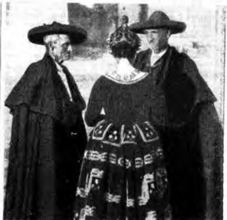
Per le strade della vecchia Castiglia, l'atmosfera tradizionale della Spagna, più che il crudo realismo dei colori, anima «Iberia» di Debussy che Vittorio Gui dirige nel corso del suo concerto (ore 21, Rete Azzurra)