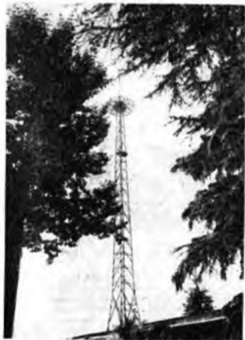
L'antenna omnidirezionale dell'emittente vaticana a onde corte. Caratteristico è il "cappuccio" terminale che le dà l'aria di un gigantesco fungo.

Quante volte i fedeli di tutto il mondo, ascoltando alla radio la voce del Pontefice, si chiedono quale possa essere l'attrezzatura tecnica e l'organizzazione della Radio Vaticana che irradia quella voce in tutti i continenti? A molti e specialmente agli italiani, affiora istintivamente l'associazione ideale di quella suggestiva voce con il genio di Guglielmo Marconi, poiché è risaputo che la Stazione Vaticana fu opera sua. Ma certamente pochi conoscono più precise notizie intorno agli impianti e alle caratteristiche di organizzazione della emittente che dallo Stato più piccolo del mondo diffonde la voce della Chiesa romana.