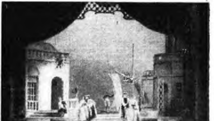
Il primo quadro di « Così fan tutte » come fu realizzato in una recente edizione alla Scala. L'opera di Mozart, verrà trasmessa sabato 2 novembre alle 21 dalle stazioni della Rete Azzurra collegate con il Teatro Comunale di Bologna. (C. M. G.)