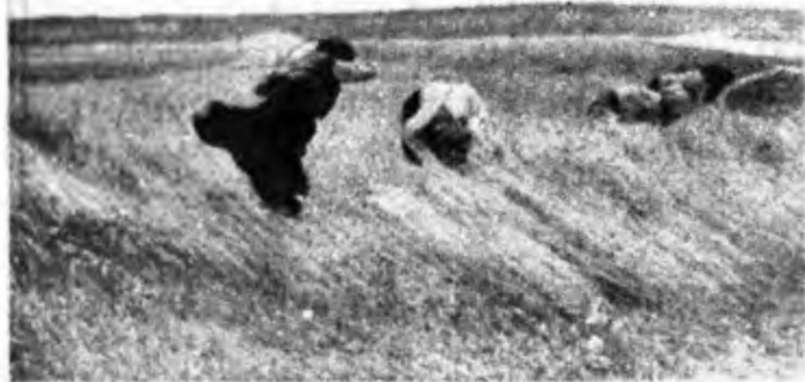
Le aspre fatiche dei contadini russi prima della organizzazione dell'agricoltura sovietica sulla base del collettivismo e della meccanizzazione, quali appaiono nel film di Eisenstein «La linea generale».