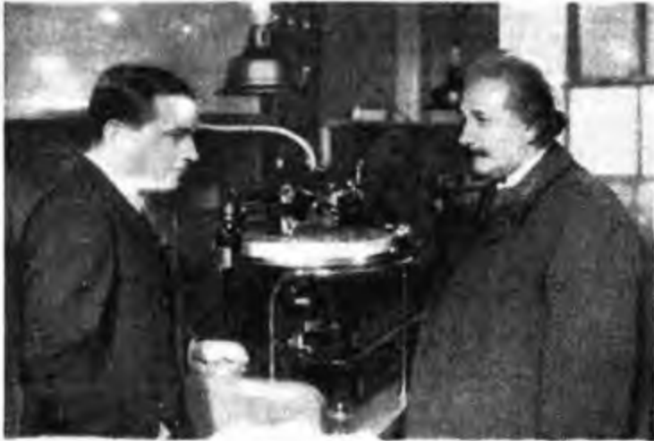
Una fotografia storica. Alberto Einstein, il grande matematico e filosofo, visita gli impianti di registrazione sonora di Hollywood al tempo della nascita del «parlato». Lo accompagna il noto attore Richard Barthelmess.