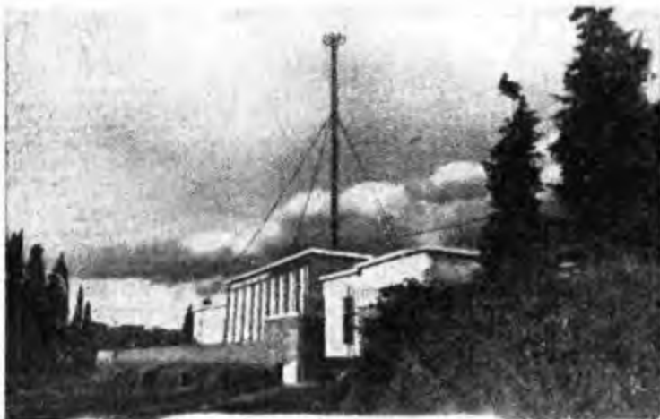
L'edificio e la nuova antenna alta 150 metri