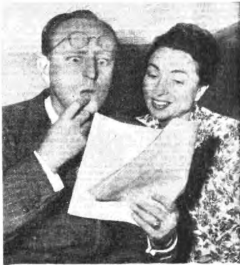
Un canone e il prezzo unitario di capione oppure... sorpresa per la notizia dell'aumento del canone d'abbonamento alla radio? Ad ogni modo Agnese Monreahad gli dimostra che il tarbamento è ingiustificato.