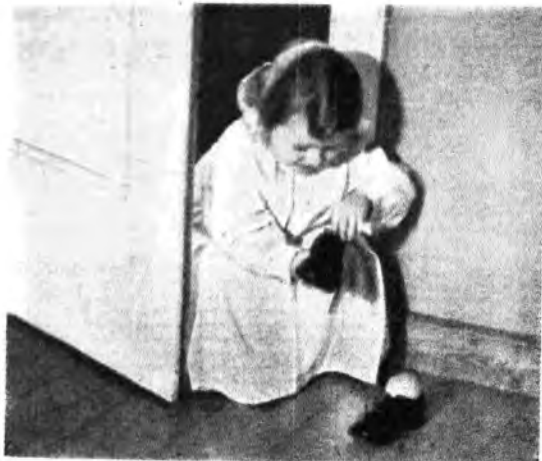
Effimia: le solite scarpine sull'uscio e l'impaziente attesa di tutti i bimbi del mondo. Oppure i doni della Befana sono modesti, si sa, ma la ingenua letizia dei bimbi è sempre la stessa.

«E sotto la gran volta del firmamento radiofonico, qualcosa di tupo e d'incompiuto, che si offre a tutti e che nessuno, tuttavia, riesce a ghermirne; qualcosa d'aereo, di fluido, di labile, che talvolta sembra lì per posarsi e che nondimeno non si ferma mai; qualcosa, insomma, che, quando credi averlo già in tua mano, scappa