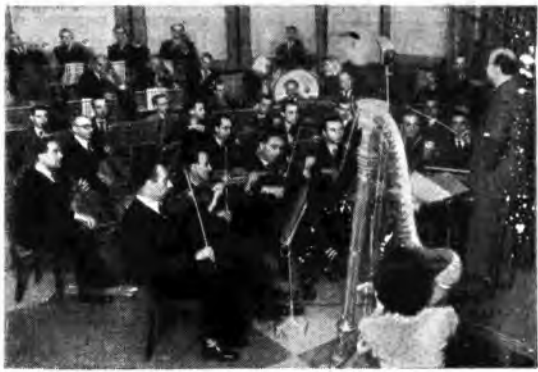
Dippo Barzizza e la sua orchestra in azione. Dalla bacchetta del maestro sprizzano ritmo e melodie per la gioia degli ascoltatori.

NAPOLI I: Concerto. PADOVA - VENEZIA - VERONA: Concerto del Duo Brunetti-Vianich: 1. Brahms: Variazioni su un tema di Haydn; 2. Debussy: En blanc et noir. PALERMO: 17-17.30 Concerto del ROMA I: 17-17.30 TORINO I: 17-17.30 Fantasia folkloristica. 17.30-18 BARI II - NAPOLI II ROMA II: Musica da ballo. 18.30 CATANIA e PALERMO: 18.30-18.45 Notiziario. GENOVA II - FIRENZE II - LANO II - ROMA II - SAN REMO - TORINO II: 18.30-18.45 Trio cowboy del Texas. NAPOLI I: 18.30-18.45 Conversazione. 19-19 BOLZANO: 19 Programma in lingua tedesca - 18.55-20 Comunità. 19.30-19.60 FADOVA: La voce dell'Università. 19.30-21 BARI II - NAPOLI II - ROMA II: « La Mus al Giro d'Italia » trasmissione organizzata per conto della Ditta Mas di Roma - Dischi di canzoni.