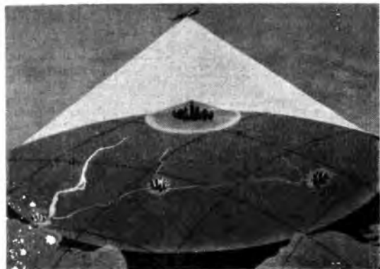
Esperimenti di «stratovisione». I due con rappresentano, uno la zona servita da una stazione emittente a terra (raggio 80 km.), l'altro la zona servita da un'emittente installata a bordo di un aereo (raggio 400 km.).