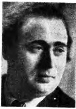
Otto Akerman, che dirige il Concerto sinfonico di questa sera (Ore 21.05 - Rete Azzurra).