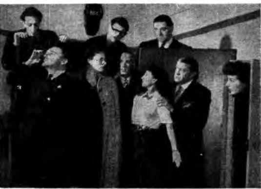
Animata scena di commedia negli studi della B.B.C. Il primo, da destra, è Tommy Handley, il più grande attore comico della radio inglese.