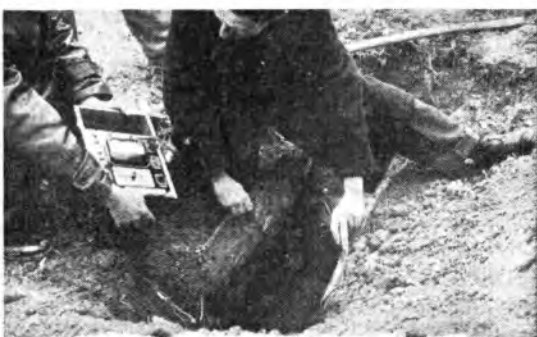
Identificazione elettrica delle placche di rame usate da Marconi.