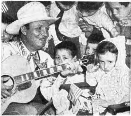
Gene Autry, popolare interprete di canzoni di « cow boys » alla Radio Americana, canta per i piccoli ricoverati dell'ospedale di Bellevue.

Siamo, dunque, oggi, agli albori di una nuova era di pace, di civiltà e di progresso — così si