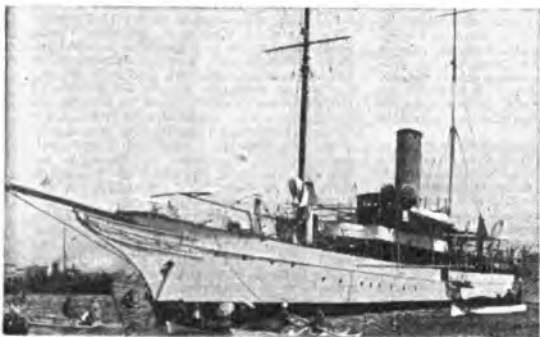
L'« Elettra », che fu sede delle più importanti esperienze di Marconi.

« L'attuazione di queste previsioni è però strettamente legata ad un più adeguato rifornimento di materie prime ed a condizioni valutarie, fiscali e di trasporto che consentano una sollecita ed efficace ripresa delle relazioni con l'estero ».