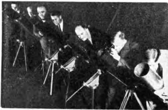
Questi membri dell'Associazione Astronomi dilettanti di Washington hanno costruito con le proprie mani i piccoli telescopi di sei pollici che si vedono nella fotografia. Le immagini del cielo vengono riflesse da una griglia lente in un primo e da questo ultimo nel cannocchiale collocato sul lato della strumento.

... due signi in cielo e l'un ne l'altro aver li roghi suoi, ed ambedue girarsi per maniera che l'uno andasse al pria e l'altro poi.