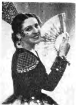
Margherita Carosio e Tilo Gobbi hanno cantato nel secondo concerto Martini e Rossi (lunedì, ore 21 - Rete Azzurra).

19.15 Notiziario. 19.40 Musica varia. 20 «Musica seria in Francia». 20.30 Canzoni e voci soliste. 21.14. 22.15 Carta bianca. 23 Notiziario. 23.15 «La notte, la man-