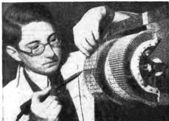
Un giovane esportista provvede al montaggio di una sezione della macchina (London Callin)