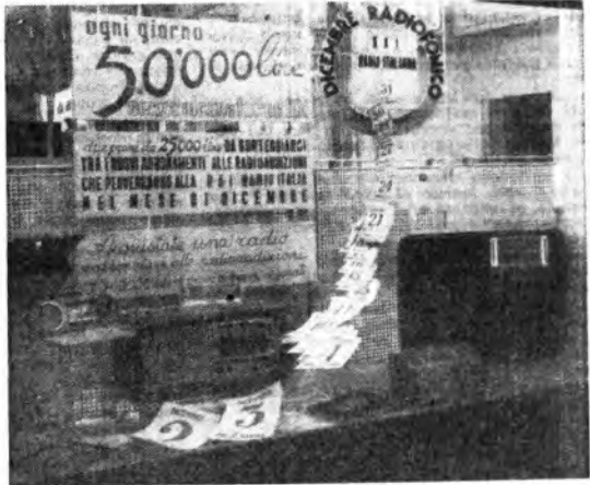
Il «dicembre radiofonico» ha ottenuto largo successo anche per i commercianti di materiale radiofonico. Ecco come ha allestito la sua vetrina la ditta Viganò di Milano in occasione della lotteria.

La carta che viene pubblicata in 25 sezioni è approssimativamente sulla scala da uno a quattro-millesimi, e ciò significa che i lineamenti geografici della superficie lunare sono ora fissati in maniera molto più precisa di quella di remote parti della superficie terrestre. Si riscontra così come la superficie visibile della Luna sia bucherellata da enormi crateri — circa 60.000. Uno conosciuto è il Newton, situato presso il polo sud della Luna, che ha una profondità di 7000 metri. La profondità può essere calcolata con esattezza misurando la lunghezza dell'ombra proiettata internamente al suo orlo. Le montagne della Luna sono su una medesima precisa scala; la cima più alta sorpassa forse l'Everest di parecchie centinaia di metri, e varie altre la oltrepassano di seicento metri. Fenditure profonde sulla superficie, che si estendono per miglia, si aggiungono al desolato e aspro panorama della Luna.