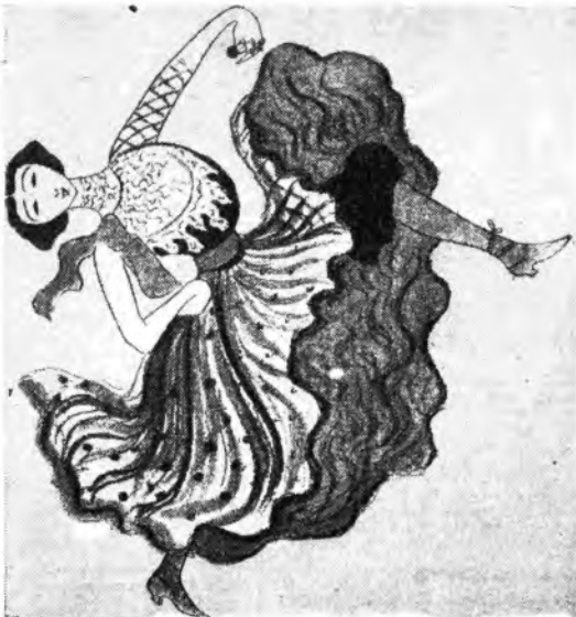
La bella Otero in un disegno di Cappello.