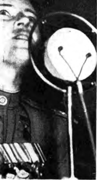
crofono in un recente congresso tenuto dalla U.D.I.

Domenica, ore 20,28 - Orchestra Barzizza (Rete Azzurra) - Lunedì , ore 13,16 Radiorchestra diretta da Galino (Rete Azzurra) - Martedì , ore 13,15 - Orchestra Campese (Rete Rossa) - Mercoledì , ore 22,20 - Orchestra Consiglio (Rete Azzurra) - Giovedì , ore 14,31 - Orchestra Vitale (Rete Rossa) - Venerdì , ore 13,30 - Orchestra Nicelli (Rete Azzurra) - Sabato , ore 13,13 - Orchestra Ferrari (Rete Rossa)