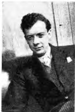
Benjamin Britten, autore della musica de "La Torre Oscura" che la Rete Azzurra trasmette questa sera alle 23.

tesis radiofonica di Padre Reginaldo Santilli, con musiche e cori di Marcello Rimoldi. 15.30 ANCONA : 15.30-15.50 Notiziario (dischi). GENOVA II e SAN REMO : 15.30-15.50 Balletto scenico e del porto. 17 - BARI I: 17 - Raccolta canzoni (dischi).