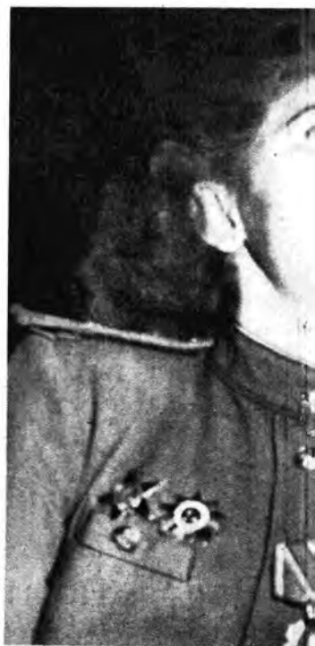
Una eroina russa, tenente dell'aviazione, parla con i

Lunedì, ore 21.05: L'asino di Buridano, ore att. di De Fiers e Gallavet (Rete