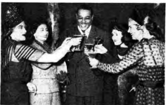
Duke Ellington riceve l'omaggio delle sue ammiratrici parigine.