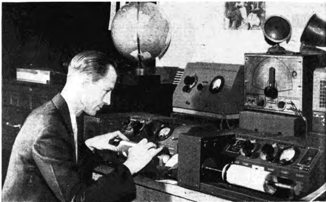
La radiolografia è diventata un mezzo comune di comunicazione. Con questi nuovi apparecchi è possibile trasmettere a distanza riproduzioni di immagini e documenti

Un grido di allarme hanno gettato in Francia e in Svizzera alcune società culturali, rilevando che la radio dei loro Paesi va sempre più riducendo il tempo concesso alle trasmissioni culturali, quali sono le conversazioni, le rubriche scientifiche, ecc. Il tempo sottratto a queste trasmissioni verrebbe invece concesso a programmi di varietà. Perché questo?