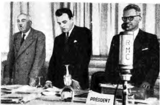
Sua Altezza il Principe Ereditario di Monaco apre i lavori dell'Assemblea generale dell'Organizzazione internazionale di Radiodiffusione tenuta a Monaco il 18 aprile scorso. Alla sua destra, Sua Ecc. De Witasse, ministro di Stato del Principato di Monaco; alla sinistra, M. Kuypers, presidente dell'Organizzazione Internazionale di Radiodiffusione. A questi importanti lavori ha partecipato anche una delegazione della RAI con a capo il Presidente on. Spataro.

rano ridotti a 129 kW. Impugnato e complesso si presentava quindi il problema della ricostruzione. Messa fu coraggiosamente affrontata dai tecnici della RAI, di questo lavoro generoso fatica voglia ricordando le tappe: il 31 dicembre 1944, la potenza complessiva raggiunse i 287 kW. Dopo la costruzione dei trasmettitori di Roma da 100 kW seguirono quelli di Firenze, di Torino, di Milano, di San Iustino, di Ancona e da ultimo quelli di Messina e di Bologna. I 129 kW oggi sono più diretti a 535. Nell'indirizzo generale dell'opera di ricostruzione della Rete radiofonica italiana, la Pubblica Istruzione presenta la situazione delle unità assegnate all'Italia, non dimenticando, per altro, gli sviluppi che ha già assistito e che assumerà in radiodiffusione circolare a onde corte, radio a lunga frequenza. Ecco dunque in breve sintesi un programma di lavori attuati dalla Radio ed in corso di attuazione; confidiamo che esso trovi consenzienti i nostri lettori.