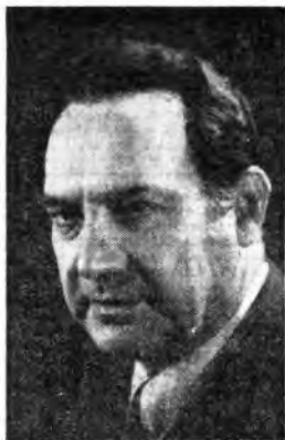
Il baritone Alessandro De Sved partecipa al Concerto Martini e Rossi di questa sera (ore 21 - Rete Azzurra).

8.30 BOLZANO : 8.30-8.40 Notiziario. TORINO : 8.35-8.35 Bolzino meteorologico. 11-11,20 BARI : 11. Canzoni 12.15 BOLZANO : 12.15-12.48 Programma in lingua tedesca. FIRENZE : 12.15-12.48 Musica operistica. GENOVA : 12.15 Musica varia - 12.30 Parlami di Genova - 12.30-12.48 La grida dello spaltatore MILANO : 12.15-12.48 Quartetto jazz Cuppini TORINO : 12.15 L'occhio sul cinema e critica teatrale - 12.30-12.48 Duo di armonica e ocarina. Pettit-Louisio VENEZIA - VERONA : 12.15 Antologia dell'opera - 12.43-12.48 Conversazione della Giunta comunale di Venezia 12.30-12.36 BOLOGNA : 12.30-12.36 Bolzino di Bologna 14 - BARI : 14. Notiziario per gli italiani del Mediterraneo - 14.10-14.20 Notiziario locale. BOLOGNA : 14.14-20 Notiziario