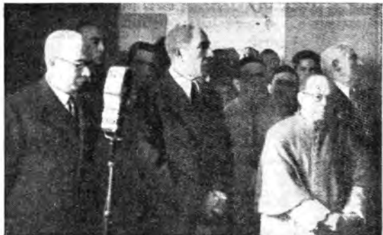
Il Prefetto di Messina al microfono durante la cerimonia inaugurale di Radio Messina.