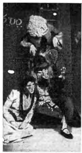
Una scena di «Lea Lebowitz» rappresentata dalla nuova compagnia del teatro ebraico. Questo teatro impiega largamente le maschere per esprimere la universalità dei sentimenti tragici o grotteschi.

È soltanto nella seconda metà dell'Ottocento che sorge un vero e proprio teatro israelita, parallelamente alla emancipazione degli ebrei nei vari Paesi. A Parigi nel 1869 il barone Goldfaden fonda il primo teatro stabile ebraico. Goldfaden è un maestro di scuola, ma anche «chansonnier» di teatro e giornalista. Ha capito che il teatro didascalico e moralistico di Bucher, Wolfson, Gotter, come più tardi di Raphaël, Biederman, Lewinshon, Axenfeld, a base di sermoni, di parabole e di prediche, non suscita alcun interesse. Perciò reagisce alla tradizione e, formando una compagnia di maestri senza lavoro, di operai, di cantori sinagogali, crea uno spettacolo con maschere e mimica, grottesco, canzoni e danze. Fu un'innovazione fortunata. Autore ed attore egli stesso, compose con profondo senso teatrale