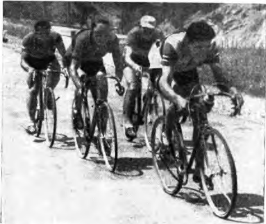
In questi giorni il Giro d'Italia appassiona le folle sportive. La Radio lo segue tappa per tappa e trasmette le notizie di ogni fase

15.30 Notiziario economico finan- ziario e movimento del porto 17 - ANCONA - BOLOGNA I: 17-17.30 «Caffè concerto».