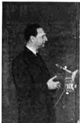
Armando La Rosa Parodi dirige il concerto sinfonico di questa sera (ore 21 - Rete Azzurra).

7.45 Effemeridi. Programma del giorno. Musica del mattino. 8 Segnale orario. Giornale radio. 8.10-8.30 Ricerche di canzoni andisperse. 12 Ritmi, canzoni e melodie. 12.45 i programmi del giorno.