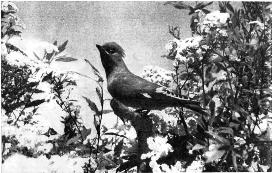
L'uccellino della radio si è preso un pomeriggio di vacanza per godere il sole e i profumi della natura in Hora

M I è capitato di ascoltare alla radio una novella: due persone che si incontrano dopo quindici anni. Non è una novella importante, nè particolarmente bella, e se ne parlo è per il fatto che essa è stata causa di alcune considerazioni esorbitanti dal suo valore artistico. Ecco: quante volte non ci è capitato, a me e a voi, di riconoscerci in un personaggio, in una situazione, in una atmosfera di una qualche trasmissione? E quante volte la nostra fantasia non ha variato a suo talento ciò che ascoltavamo? Di quella storia senza nodi, per esempio, ho inventato subito per mio uso un racconto (che non ho scritto nè forse scriverò mai): ecco, mettiamo che io domani incontri la fanciulla che amavo dodici anni fa e che appunto da dodici anni non rivedevo; ricostruisco in una certa maniera l'incontro: ma altrimenti ero solito sognarlo quest'incontro, durante gli anni in cui soffrivo a ripensare a lei. Desideri di rivincita? Che povera cosa, in fondo, ricomparirle dinanzi per questo. Chiedo scusa ai lettori se per un momento ho parlato di fatti personali. Ma intendevo appunto mostrare con ciò quanto sia un fatto personale l'ascolto, e inoltre quanto il racconto, il romanzo, la novella, la commedia