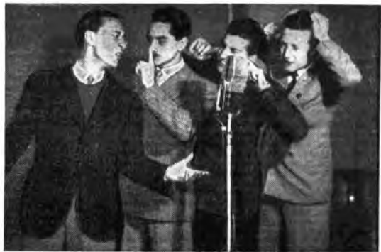
« Il quartetto azzurro » di Radio Roma si prepara per la trasm. di « Ragazzo spazioso... »

Solo in casi eccezionali quelle partiture sono opera degli autori del «motivo» delle canzoni. A questi uccelli canterini non si deve generalmente chiedere di più d'una buona melodia, fresca e possibilmente originale. Il resto non è affar loro. Non è affar loro, qualche