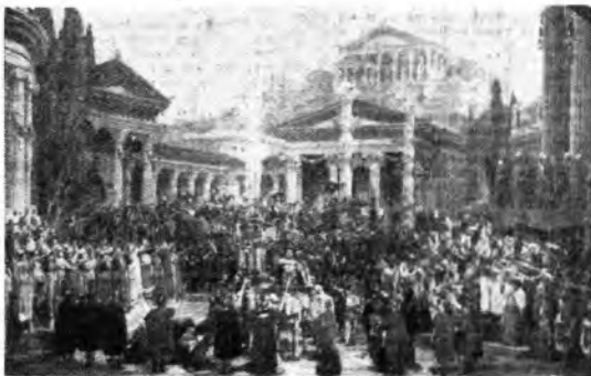
Con « La Vestale » avrà inizio, sabato 7 giugno, la stagione lirica della RAI

Offerti dall'Organizzazione Jonasson - Pisa, da oltre 25 anni il meglio in profumeria