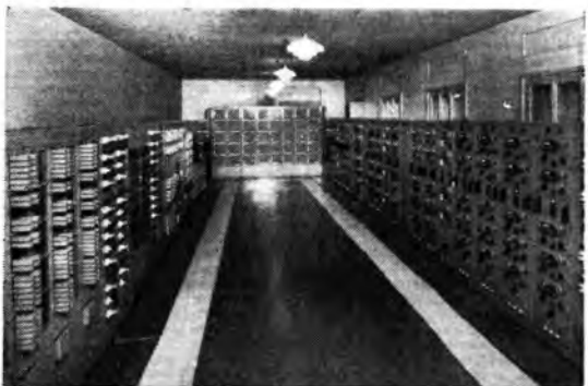
La sala amplificatori di Radio Torino: su novanta telai sono installati quasi duecento amplificatori con circa seicento valvole amplificatrici, un migliaio di relé, tremilacinquecento lampade di segnalazione.