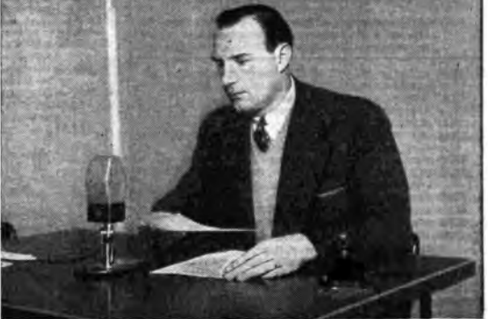
Mister Cleveland, vice capo della missione U.N.R.R.A. in Italia, prima di lasciare il nostro paese per raggiungere la Cina, quasi capo della missione dell'U.N.R.R.A. in quel paese, ha rivolto dai microfoni di Radio Roma un saluto di commiato alla popolazione italiana.