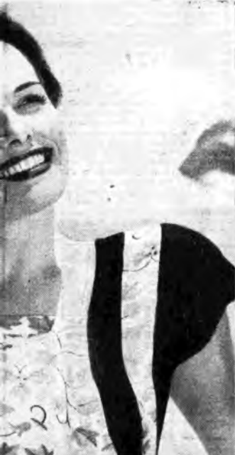
...a, diompe. La sua attività fondamentale resta quella del... ...orre ai microfoni della N.B.C. per uno dei suoi concerti.

Domenica, ore 21.05: Orchestra Gallino (Rete Rossa) - Lunedì, ore 22.15: Orchestra Cetra (Rete Azzurra) - Martedì, ore 14.35: Orchestra Ferrari (Rete Rossa) Mercoledì, ore 21: Orchestra Cetra (Rete Azzurra) - Venerdì, ore 21.40: Orchestra Campese (Rete Rossa) - Sabato, ore 13.20: Orchestra Armoniosa (Rete Azzurra).