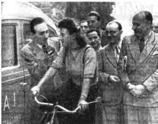
«Signorina, che ne pensa della crisi?», ha chiesto a bruciapelo un nostro cronista a questa bella ragazza in una strada di Roma. E la ragazza, da buona romana, se l'è cavata con molto spirito.