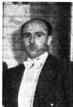
Pianista Pietro Scarpini