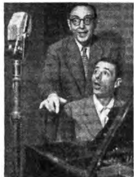
Vanni e Romigioli durante i cinque minuti di Motta.

ANCONA: 12,50-12,56 Rubrica variis - 14 Dischi - 14,09-14,19 Notiziario regionale - 17-17,30 Concerto vocale Soprano C. Toschi, Tenore D. Cacciaro DANI I: 11-11,30 Canzoni - 15,13 Notiziario - 15,20-15,30 Notiziario per gli italiani del Montenegro - 18 «Saraceni Catevra», di Grand Nazariantz - 18,20 Converzazione - 18,30 Notiziario arabo - 18,45-19 Notiziario per gli italiani della Venezia Giulia. BOLOGNA I: 12,50-12,56 Rubrica varia - 14 Dischi - 14,09-14,18 Notiziario