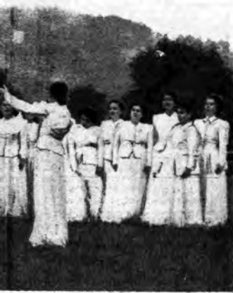
...to si è segnalato brillantemente nel concerto internazionalmente a Langelen, nel Galles

Domenica , ore 21,45: Orchestra Nicelli (Rete Azzurra) - Lunedì , ore 13,15: Orchestra Cetra (Rete Azzurra) - Martedì , ore 22: Cabaret internazionale , con l'orchestra diretta da Petralia (Rete Rossa) - Mercoledì , ore 13,15: Orchestra Mojetta (Rete Azzurra) - Giovedì , ore 18: Danze campestri (Rete Azzurra) - Venerdì , ore 14,35: Canzoni (Rete Rossa) - Sabato , ore 20,28: Radiorchestra diretta da Gallino (Rete Azzurra).