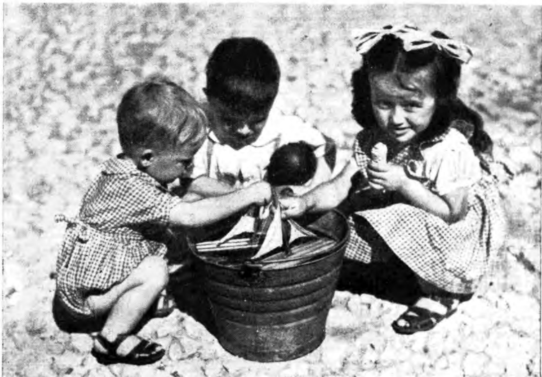
A QUESTI BIMBI AVEVANO PROMESSO IL MARE... ED ESSI HANNO RISOLTO IL PROBLEMA SUL GRETO DI UN TORRENTE CON UN MODESTO SECCHIO D'ACQUA

4 volumi quattro punti cardinali per la vostra cultura