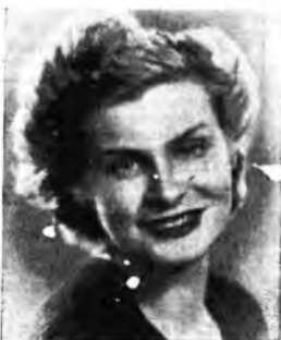
N soprano Lydia Stix, che gli ascoltatori hanno più volte sentito da Radio Bolzano, è stata chiamata a portare il contributo della propria arte interpretativa al Festival di Salisburgo.

18,55 Movimento parti dell'isola. 19 Musiche richieste. 19,50 Attualità sportiva. 20 Segnale orario. Giornale radio. Notiziario regionale. 20,30 Il quarto d'ora. 20,45 I cinque col ritmo. 21,15 Concerto di musiche operistiche. 22,15