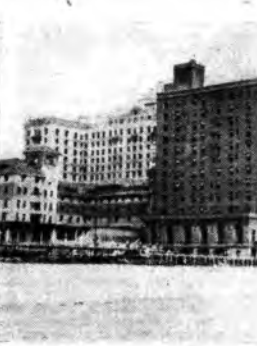
L'Hotel Ambassador di Atlantic City, nel quale hanno luogo i lavori della Conferenza

MOLTE riviste e alcuni quotidiani pubblicano da qualche tempo a questa parte rubriche dedicate alla radio, in cui si discutono problemi radiofonici, si illustrano i programmi che la Radio Italiana ha trasmesso e quelli che deve trasmettere.