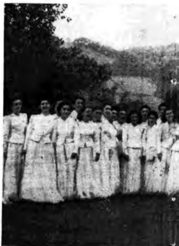
Il coro portoghese del Gruppo Musicale Femminile di Op. nazionale di canto corale seniores rec

Lunedì, ore 20.28: Bolero , tre atti di Durand (Rete Rossa) - Giovedì , ore 21: Maria Maddalena , tre atti di Hebbel (Rete Azzurra) - Venerdì , ore 22.05: Signorine , un atto di Murolo (Rete